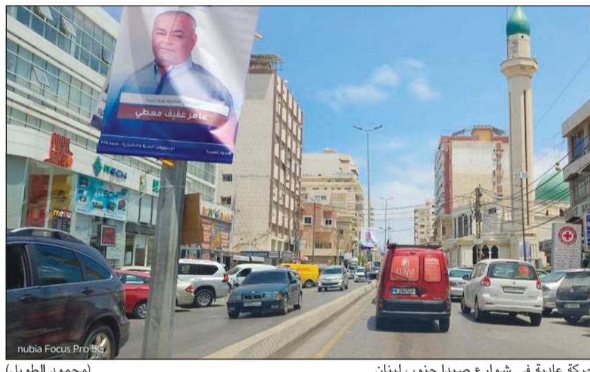
حركة عادية في شوارع صيدا جنوب لبنان

دائرة صيدا - جزي، إذ شكلت الانتخابات البلدية والاختيارية «بروفة جيدة» للتجربة النيابية السنّة المقبلة، وعودة «التيار» نيبانياً. وتوجه قائد الجيش العماد رودولف هيل إلى العسكريين بمناسبة انتهاء الانتخابات البلدية والاختيارية ومهمات حفظ الأمن المتعلقة بها، بكلمة هنأهم فيها «على أدائكم المشرف خلال مواكبة الانتخابات البلدية والاختيارية، في مرحلة دقيقة يشهد فيها وطننا تحديات استثنائية. لقد أنتم مجدداً أنكم على قدر الثقة والمسؤولية، حاضرين بكل التزام وانضباط، ومؤتمنين على حماية وجه لبنان الديموقراطي». وأضاف «إن ما قمتم به لتأمين الظروف المناسبة، ومعالجة الإشكالات بحكمة واحتراف، فضلاً عن ملاحقة مطلق النار وتوقيفهم، كله ساهم في إنجاح هذا الاستحقاق الوطني، وعكس صورة مشرقة عن دور الجيش كضامن للاستقرار وحام للدستور. مسؤوليتنا كبيرة، لكن تقني بكم وبصلايتكم تجعلني على يقين بأننا سنواصل مسيرة الشرف والتضحية والوفاء، مهما اشتدت الصعاب، حفاظاً على أمن الوطن وكرامة شعبه». وبانتهاؤه العملية الانتخابية، يسجل للحكومة الإشراف الحادي والمتابعة المسؤولة. فيما تعود عجلة الحركة السياسية إلى نشاطها السابق. وفي هذا الإطار، ذكرت مصادر دبلوماسية أن محادثات الملف النووي في جنيف ناقشت موضوع الموقوفين من جنسيات مختلفة سواء في العراق أو إيران ومنهم الجنسية الإسرائيلية، ما يفتح الباب أمام مناقشة مصير الأسرى اللبنانيين لدى إسرائيل.