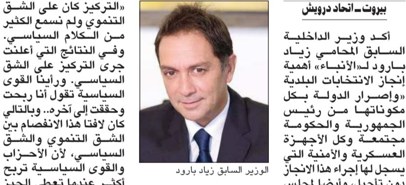
الوزير السابق زياد بارود