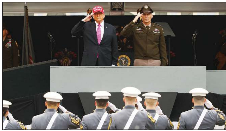
الرئيس الأميركي دونالد ترامب مؤدياً التحية العسكرية لخريجي أكاديمية «وست بوينت» قرب نيويورك

واشنطن - أ.ف.ب: أشاد الرئيس الأميركي دونالد ترامب بما قام به لجهة «تحرير» القوات المسلحة من تأثير النظريات المتعلقة بالتنوع الاجتماعي أو عدم المساواة على أساس العرق، ووصفها بأنها «مصادر إلهاء» للجيش عن «مهمته الأساسية المتمثلة في تدمير أعداء أميركا». وقال ترامب في حفل تخرج في أكاديمية «وست بوينت» العسكرية المرموقة بالقرب من نيويورك أمس الأول: «نعمل على إزالة عوامل الإلهاء ونعيد تركيز قواتنا المسلحة على مهمتها الأساسية المتمثلة في تدمير أعداء أميركا». وتابع «حررنا قواتنا من تعاليم سياسية مهينة ومثيرة للانقسام». وأضاف أن «مهمة القوات المسلحة الأميركية ليست تنظيم عروض ولا نشر الديموقراطية بقوة السلاح»، متقدماً بذلك الإدارات الجمهورية والديموقراطية السابقة خلال الأعوام العشر الماضية، لإسيما بسبب التدخلات العسكرية في أفغانستان والعراق. وأكد الرئيس الجمهوري وأضعا قبعة حمراء تحمل شعاره «لنجعل أميركا عظيمة مجدداً» أن «مهمة القوات المسلحة هي القضاء على أي تهديد لأميركا، في أي مكان، وفي أي وقت». وتابع «لن تفرض بعد الآن نظرية العرق النقديّة على رجالنا ونسائنا الشجعان في الجيش، أو على أي شخص آخر في هذا البلد». ونظرية العرق النقديّة هي تخصص يدرس تأثير عدم المساواة على أساس العرق، على عمل المؤسسات الأميركية. وجاء حديث ترامب هذا، قبل ثلاثة أسابيع من العرض العسكري الذي أمر بإقامته للاحتفال بالذكرى الـ 250 لتأسيس القوات المسلحة الأميركية في 14 يونيو المقبل، والذي يصادف عيد ميلاده التاسع والسبعين. على صعيد آخر، دافع الرئيس الأميركي عن قرار