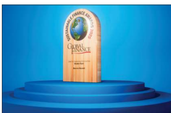
جائزة الريادة المالية في استدامة المجتمعات