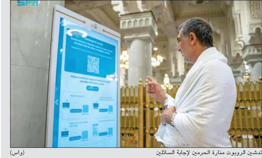
تدشين الروبوت منارة الحرمين لإجابة السائحين (واس)

خطتها التشغيلية لموسم الحج التي تضمنت 120 مبادرة إثرائية و10 مسارات إثرائية ذكية لتعزيز التجربة الرقمية لحجاج بيت الله الحرام و50 برنامجا علميا. وشملت الخطة تدشين النسخة الثانية من الروبوت الاصطناعي (منارة) الخام ويحد من الانبعاثات الكربونية. وفي مجال النقل، سخر مركز إرشاد الحافلات الناقلة لحجاج الخارج بمكة المكرمة أحدث التقنيات الذكية ضمن خطته التشغيلية لموسم الحج من خلال توجيه الحافلات وإبصارها بكفاءة عالية عبر منصة (أرشدني) الذكية التي تدار من خلال غرفة تحكم ومراقبة متكاملة. وفي السياق، أطلقت رئاسة الشؤون الدينية بالمسجد الحرام والمسجد النبوي