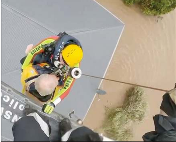
مروحية تنقذ أحد العالقين من سطح منزله في بلدة تاري بولاية نيو ساوث ويلز