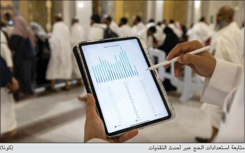
متابعة استعدادات الحج عبر أحدث التقنيات (كونا)

الصيانة من بينها استخدام معدة حديثة تعمل على إعادة تدوير كامل طبقات الأسفلت وما تحتها. وتعتبر هذه التقنية صديقة للبيئة، حيث تعيد استخدام ما يصل إلى 100٪ من المواد الموجودة، مما يقلل الحاجة إلى المواد الخام ويحد من الانبعاثات الكربونية. وفي السياق التقني، أطلق التطبيق الوطني الشامل (توكلنا) خدمة استعراض تصاريح الحج لهذا العام، وذلك بالربط مع المنصة الرقمية الموحدة لتصاريح الحج (منصة تصريح) التي دشنتها مؤخرا وزارة الداخلية بالشراكة مع الهيئة السعودية للبيانات والذكاء الاصطناعي (سدايا). وبخصوص الطرق وصيانتها، فقد اتبعت الهيئة العامة للطرق أحدث التقنيات في