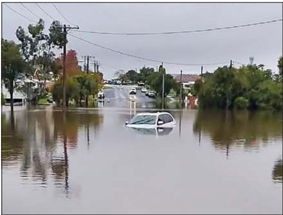
سيارة غارقة في أحد شوارع بلدة تاري في ولاية نيو ساوث ويلز