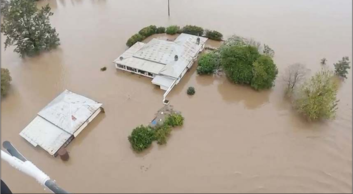
الفيضانات تغرق بلدة تاري في ولاية نيو ساوث ويلز

سيدني - أ.ف.ب: أسفرت الفيضانات العارمة التي سببتها أمطار غزيرة هطلت في شرق أستراليا أمس، عن مقتل شخصين على الأقل وتقطع السيل بنحو 50 ألف شخص، بحسب ما أعلنت السلطات. وقال مصدر إن الشرطة انتشلت جثتين من المياه في منطقة ميد نورث كورسست الريفية على مسافة نحو 400 كيلومتر شمال شرق سيدني. وفي بعض المناطق