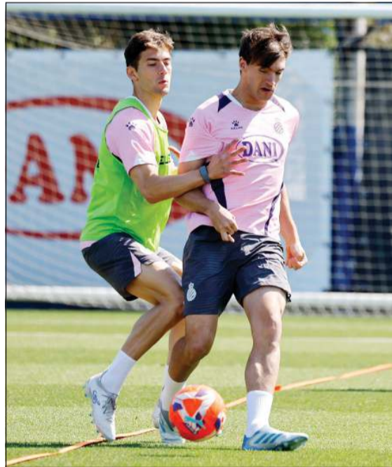
لاعبا إسبانيول في التدريبات الأخيرة

تتنطلق منافسات المرحلة الـ 38 الأخيرة من الدوري الإسباني لكرة القدم «الليغا» اليوم بإقامة لقاء وحيد يجمع بين ريال بيتيس وضيفه فالنسيا، وتستكمل المنافسات غدا السبت، حيث يلتقي ريال مدريد مع ريال سوسبيدادا، وإسبانيول مع لاس بالماس، وليغانيس مع بلد الوليد، وديبورتيغو ألافيس مع أوساسونا، وختتافي مع سلتا فيغو، ورايو فايكانو مع مايوركا. ولن يكون هناك الكثير للعب من أجله في هذه المرحلة بعدما حسم برشلونة التتويج بلقب الدوري للمرة الثامنة والعشرين في تاريخه بعد فوزه على إسبانيول بهدفين نظيفين يوم 16 الجاري، وتأهله مع ريال مدريد وأتلتيكو مدريد وأتلتيك بلباو وفاريال لدوري الأبطال في الموسم المقبل.