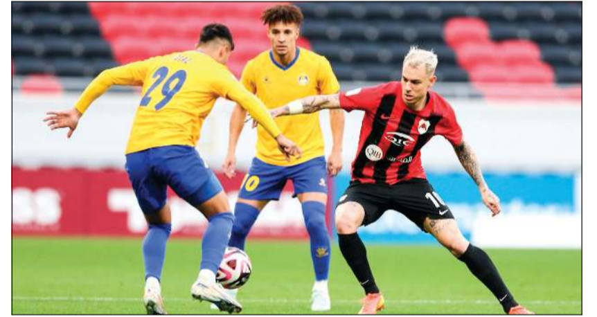
مواجهة نارية متقطعة بين الريان والغرافة