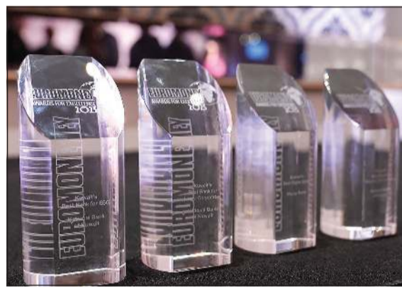
جوائز بنك الكويت الوطني التي حصدتها من مجلة «يوروموني» العالمية

علاقات واسعة وخبرات عميقة تمكنه من تقديم خدمات مصرفية استثنائية للشركات، ما يعزز مكانته كشريك مالي موثوق للقطاع الخاص والمؤسسات الكبرى في الدولة. ومنحت «يوروموني» جائزة أفضل بنك في التنوع والشمول على صعيد القطاع المصرفي الكويتي، استنادا إلى مجموعة من المعايير، تتضمن تطوير وتطبيق أهداف واضحة للتنوع والشمول، وإطلاق برامج ومبادرات تعزز التنوع والشمول في بيئة العمل، وعدد الأفراد المتأثرين إيجابيا بجهود التنوع والشمول، وحجم التنوع بين الموظفين، وتوفير برامج