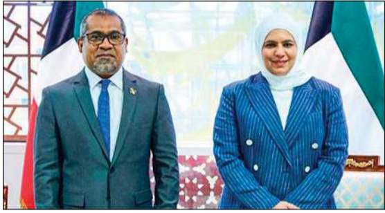
وزيرة المالية ووزيرة الدولة للشؤون الاقتصادية والاستثمار نورة الفصام خلال استقبالها وزير خارجية جمهورية الماديف د.عبدالله خليل

من خلال تمويل العديد من المشاريع في القطاعات الحيوية في الماديف ودوره في دعم التنمية الاقتصادية والاجتماعية فيها. وفي هذا السياق، قالت وزيرة نورة الفصام: «تعتبر الماديف شريكاً مهماً للكويت في تعزيز التعاون الاقتصادي والتنموي، وتطلع إلى مزيد من التعاون في المرحلة المقبلة وفق أهداف وتطلعات مشتركة تساهم في تحقيق الأهداف التنموية المشتركة وخلق فرص استثمارية جديدة تعود بالنفع على البلدين الصديقين».