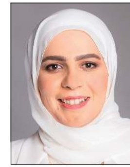
وزيرة المالية ووزيرة الدولة للشؤون الاقتصادية والاستثمار نورة الفصام