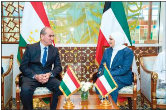
وزيرة المالية ووزيرة الشؤون الاقتصادية والاستثمار نورة الفصام خلال المباحثات مع نائب رئيس وزراء جمهورية طاجيكستان عثمان زاده عثمان علي

الشراكات الاقتصادية وتعميق الروابط المالية مع دول آسيا الوسطى بشكل عام، ومع جمهورية طاجيكستان بشكل خاص، وتنتقل إلى استكشاف المزيد من الفرص الاستثمارية بما يحقق المنفعة والمصلحة المشتركة، وفي ختام اللقاء، تم الاتفاق على متابعة العمل الثنائي والزيارات الرسمية للوقوف والإطلاع على الفرص الاستثمارية المتاحة من القطاعات الحيوية، ما يمهّد الطريق لتعزيز التعاون الاقتصادي والتنموي بين البلدين.