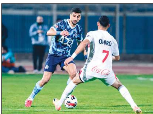
المواجهة تتجدد بين الزمالك وبيراميدز