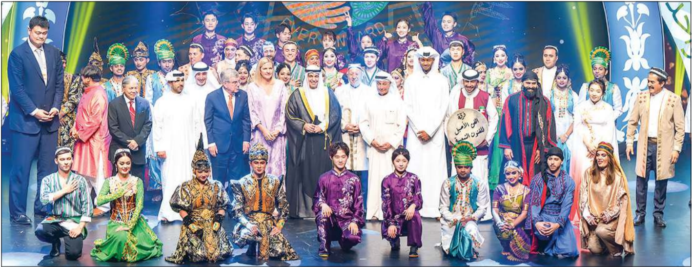
الوزير عبدالرحمن المطيري والشيخ فهد الناصر مع د.توماس باخ وكريستي كوفنتردي وأعضاء المجلس الأولمبي الآسيوي وممثلي اللجان الأولمبية الوطنية خلال حفل افتتاح «عمومية الأولمبي الآسيوي»

تقديرًا لإسهاماته البارزة في الحركة الأولمبية إبان رئاسته التي امتدت أكثر من 12 عاما وتنتهي يونيو المقبل، كما هنا الرئيسة المنتخبة للجنة كريستي كوفنتردي لفوزها بالمنصب. وأوضح أن الرياضة الآسيوية حصلت إنجازات باهرة على مستوى العالم وصنعت إرثا مشرفا عبر تاريخها الرياضي الكبير، مشيرا إلى أن الاجتماع يعد فرصة لإبراز وحدة القارة وتنوعها وروحها من الشرق الغرب ومن الشمال والجنوب، وأنه رسم مسارا لمستقبل أكثر إشراقا. من جانبه، أكد باخ الدور المهم الذي تقوم به القارة الآسيوية، إذ إنها «ليست قارة كبيرة عريق وحاضر مميز في كل المجالات ومنها الرياضة، كما أن لها تأثيرا طائفا على الرياضة العالمية».