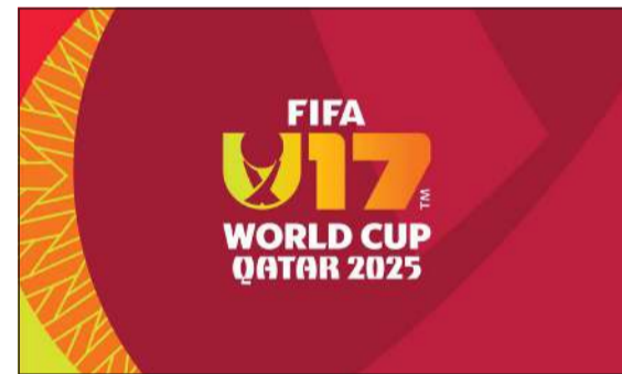
شعار مونديال تحت 17 عاماً «قطر 2025»

ستمثل محطة مهمة في رزنامة قطر الكروية على مدار الخمسة أعوام المقبلة. ومنذ بداية هذا العقد، استضافت قطر بطولات كروية متميزة على المستويات الإقليمية والقارية والعالمية، وتأتي بطولة كأس العالم تحت 17 عاماً استكمالاً لجهودنا بدعم تنمية كرة القدم وانطلاقاً من حرصنا على تطوير الأجيال المقبلة من الرياضيين»، مضيفاً «نتطلع لاستقبال المنتخبات الشبابية الدولية في أول نسخة من بطولة كأس العالم تقام بمشاركة 48 فريقاً من 3 إلى 27 نوفمبر 2025، ونأمل أن تعطيهم تجربة المرافق والمنشآت عالية المستوى في دولة قطر لحة ملهمة عما يحمله مستقبل مسيراتهم الكروية». من جهته، قال الأمين العام