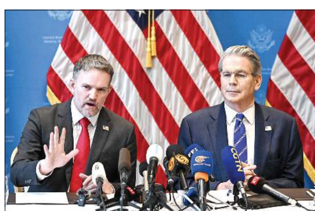
وزير الخزانة الأميركي جيمس غريغور خلال مؤتمر صحافي للإعلان عن الاتفاق التجاري بين أميركا والصين

وكالات: أعلنت الولايات المتحدة الأميركية والصين أمس، عن التوصل إلى اتفاق لتعليق جزء من رسوميها الجمركية لمدة 90 يوماً، حيث سيدخل القرار حيز التنفيذ اعتباراً من غد الأربعاء، وذلك في إطار سعي واشنطن وبكين لإنهاء حرب تجارية أربكت الاقتصاد العالمي وأثارت قلق الأسواق المالية. وأعلن وزير الخزانة الأميركي جيمس غريغور، خلال مؤتمر صحافي بحضور الممثل التجاري الأميركي جيمس غريغور ونائب رئيس مجلس الدولة الصيني لي فينغ، عن خفض الرسوم الأميركية على البضائع الصينية من 145٪ إلى 30٪ لمدة 90 يوماً، فيما أعلنت الصين خفض التعريفات الجمركية على أميركا من 125٪ إلى 10٪ لمدة 90 يوماً. وأدى التقدم المحرز في محادثات التجارة، إلى ارتفاع في أسواق الأسهم العالمية وقوة في أداء الدولار، حيث ارتفعت العقود الآجلة للأسهم الأميركية بنحو 3٪، وارتفعت الأسهم الأوروبية في بداية التداولات.