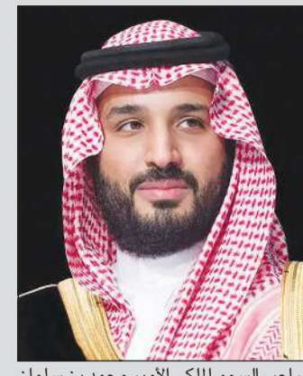
صاحب السمو الملكي الأمير محمد بن سلمان ولي العهد رئيس مجلس الوزراء السعودي

محمد بن سلمان يطلق شركة "هيومان" كراند عالمي بالكفاء الاصطناعي ولي العهد السعودي سيرأس مجلس إدارة الشركة الجديدة.. وستعمل على تطوير أحد أفضل النماذج اللغوية الكبيرة "LLM" باللغة العربية