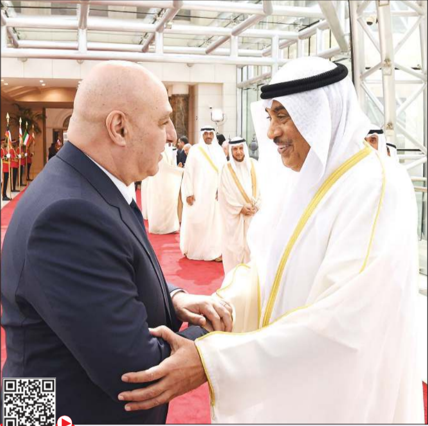
صاحب السمو الأمير مشعل بن عبدالعزيز آل سعود مع الرئيس اللبناني العماد جوزف عون