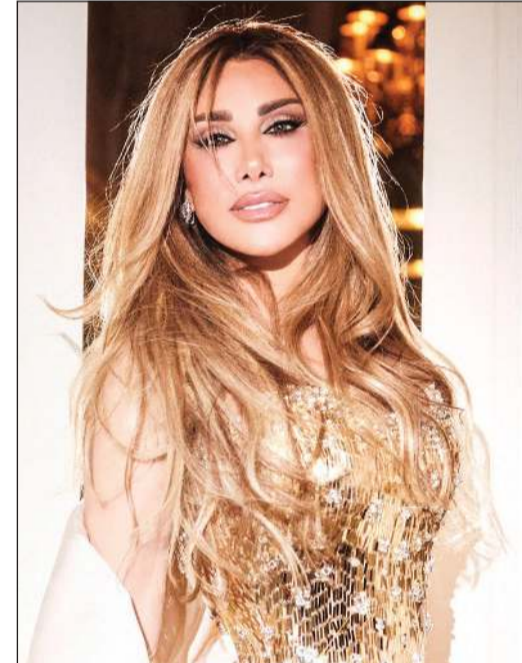
بيروت - بولين فاضل

طرحت الفنانة نجوى كرم أحدث أعمالها الغنائية بعنوان «زين الزين»، التي لاقت تفاعلا واسعا على مواقع التواصل الاجتماعي فور صدورها، وسط إشادة من جمهورها بجمال الكلمات وقوة الأداء. وأطلقت نجوى الأغنية عبر قنواتها الرسمية على «يوتيوب»، إلى جانب منصات الاستماع والموسيقى المختلفة، وهي من كلمات: محمد درويش، ألحان: أحمد بركات، توزيع موسيقي: سليمان دميان، وجاءت ضمن لون غنائي لبناني شعبي بلمسة عصرية. شاركت كرم جمهورها عبر حسابها الرسمي على «إنستغرام» مقطع فيديو من الأغنية، معلقة: «زين الزين أخيرا وصل، أتمنى أن يلمس قلوبكم»، في إشارة إلى حماسها لتفاعل الجمهور مع العمل الجديد. وتعكس كلمات الأغنية قوة العاطفة والفخر، ويقول مطلعها: «ويلي يا ويلي بضعف ضعفين».