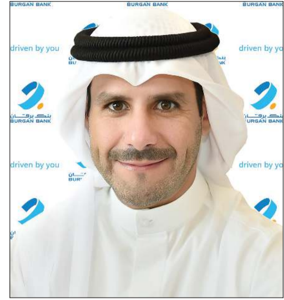
الشيخ عبدالله الناصر

وفي فبراير 2025، أعلن بنك برقان عن إنشاء برنامج استراتيجي لشهادات الإيداع (Certificate of Deposits) في الكويت بقيمة 500 مليون دولار، حيث منحته وكالة فيتش تصنيفاً ائتمانياً عند درجة «F1» بما يعادل درجة «A»، مما يعكس الجودة الائتمانية للبنك. وقيادة فريق