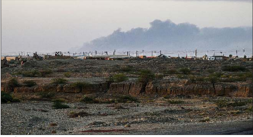
الدخان يتصاعد من مطار بورتسودان بسبب قصف مسيرات «الدعم السريع»

عواصم - وكالات: أعربت وزارة الخارجية عن إدانة دولة الكويت واستنكارها للاعتداءات التي استهدفت المرافق المدنية الحيوية الضرورية لمدينتي كسلا وبورتسودان بجمهورية السودان، مما يعدّ منعطفًا خطيرًا في الصراع الدائر في السودان. ووجدت الوزارة مطالبة دولة الكويت المستمرة بعدم استهداف المرافق والمراكز المدنية والتي تشكل رافداً حيوياً لحياة السكان، كما دعت في الوقت نفسه إلى وقف إطلاق النار والالتزام بما جاء في إعلان جدة الصادر في 11 مايو 2023، والذي يؤكد على ضرورة حماية المدنيين مع المحافظة على استقلال السودان ووحدة أراضيه ودعم مؤسساته الوطنية.