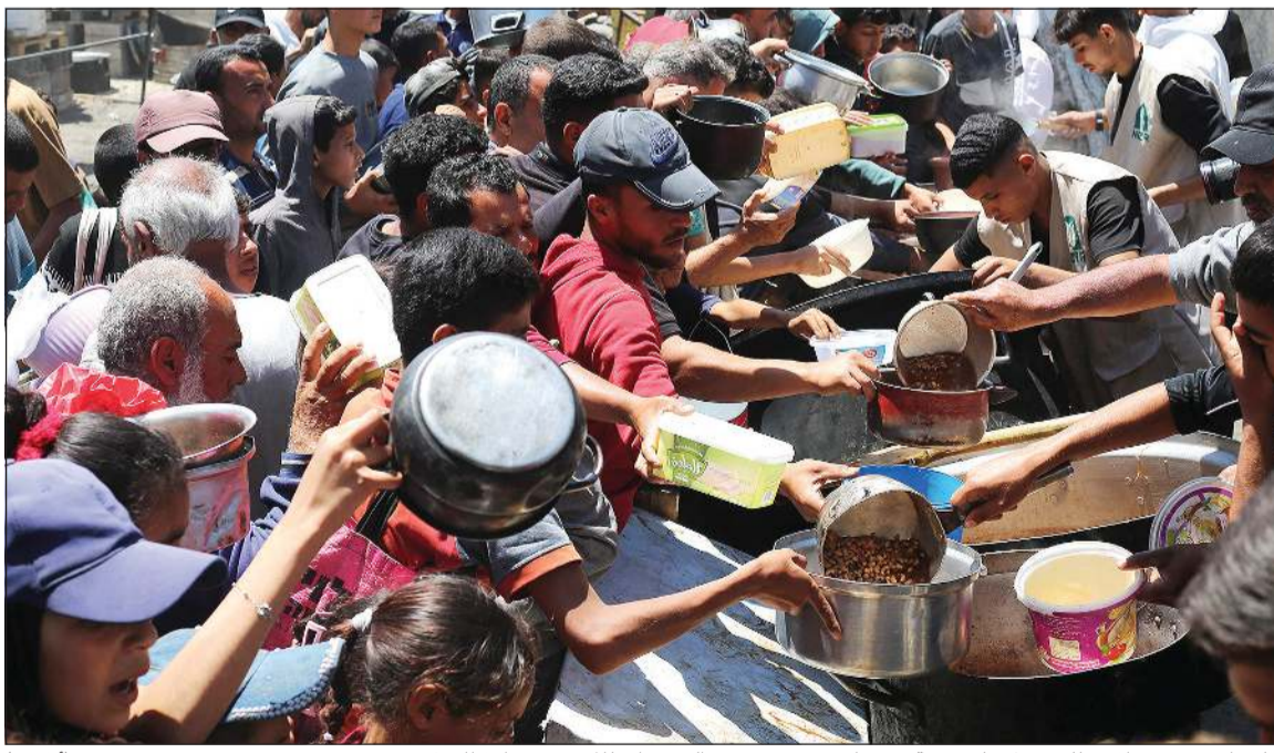
فلسطينيون يصطفون للحصول على وجبة في مطبخ خيري بمخيم النصيرات للاجئين وسط قطاع غزة

في بلدة عيسان شرق خان يونس». وقال المتحدث باسم الجيش الإسرائيلي أن عشرة جنود إسرائيليون قتلوا جراء غارة جوية إسرائيلية استهدفت خيمة في منطقة الموصي في خان يونس، مؤكداً أن «طفلاً وسبع نساء» قتلوا في هذه الغارة. وأشار إلى أنه نقل «تسعة مصابين» جراء غارة جوية استهدفت مخزناً بؤوي عشرات النازحين في حي الشيخ رضوان في شمال غرب مدينة غزة.