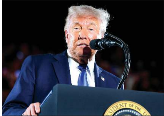
الرئيس الأميركي دونالد ترامب

الذي يقول إنه يمثل أساقفة الولاية في تعاملهم مع الحكومة، انتقادات لصورة نشرها ترامب على منصبه «تروث سوشيل»، مولدة بتقنية الذكاء الاصطناعي وهو يرتدي زي البابا، بعد أن كان قد مارح صحافيين في وقت سابق بأنه يود أن يكون البابا الكاثوليكي المقبل. ويظهر ترامب في الصورة بالرداء البابوي الأبيض بينما يشير بسببائه اليمنى نحو السماء.