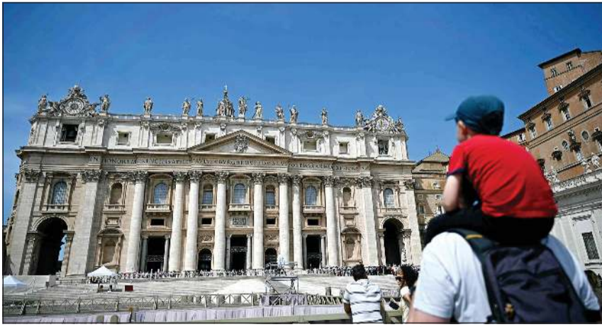
سجاي في ساحة القديس بطرس بالقاتكان