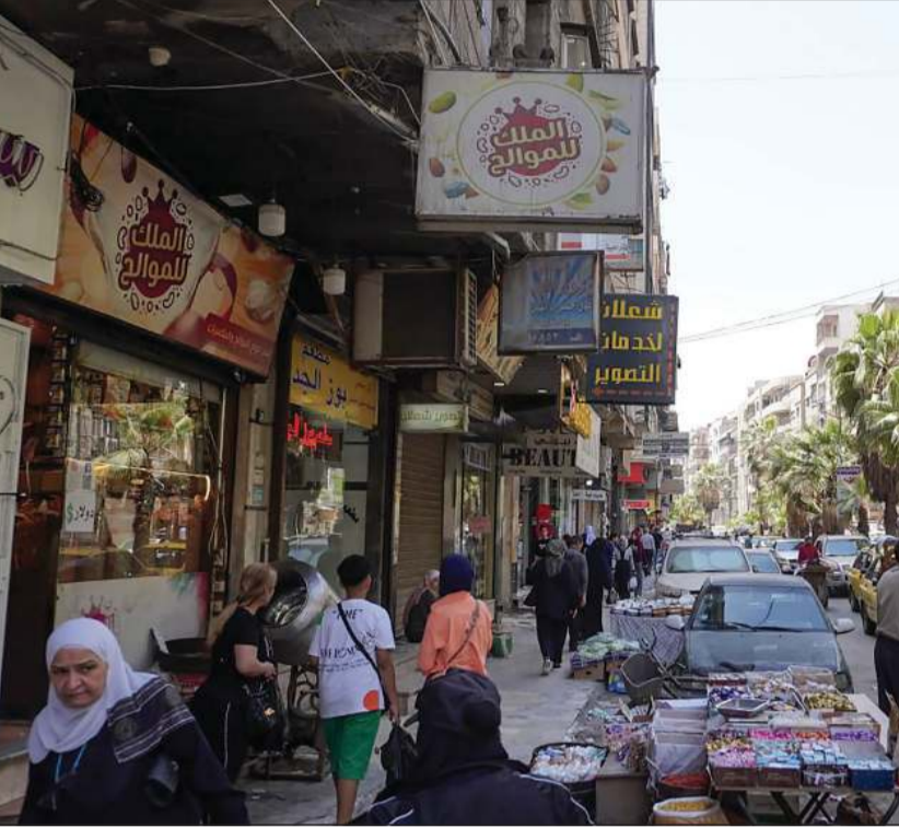
صورة نشرتها وكالة الأنباء الرسمية «سانا» لعودة الحياة إلى طبيعتها في جرمانا