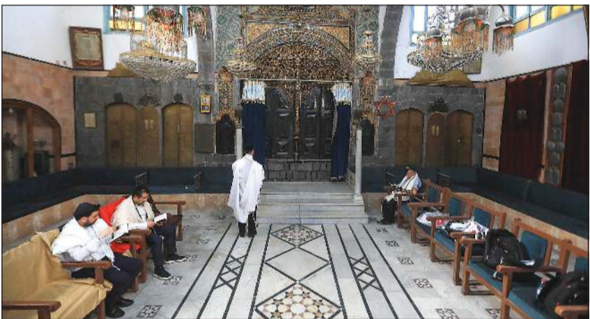
يهود سوريون - أميركيون يزورون طقوسهم في كنيس الإفرنج بدمشق (أ.ف.ب)

دمشق - أ.ف.ب: أدى وفد من اليهود السوريين المقيمين في الولايات المتحدة، طقوسهم في كنيس الإفرنج في دمشق القديس أمس، في إطار سلسلة زيارات تشبهها العاصمة السورية منذ الإطاحة بحكم بشار الأسد. وتأتي الزيارة عقب إعلان رئيس الطائفة اليهودية في سورية بخور شمنطوب أن مجهولين اقتحموا منصف الأسبوع الماضي مقبرة اليهود حيث قاموا بأعمال تخريب قرب قبر الحاخام حاييم فيتال الذي يعد من رموز التصوف اليهودي.