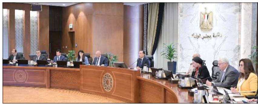
الاجتماع الحادي والأربعون لمجلس الوزراء برئاسة د.مصطفى مديبولي