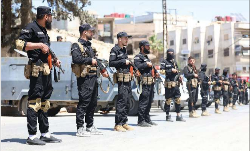
صورة وزعتها وزارة الداخلية السورية لانتشار عناصر الأمن العام في جرمانا بريف دمشق

وكالات: أعلنت وزارة الداخلية السورية تعزيزات أمنية وفرض طوق أمني في مدينة جرمانا في ريف دمشق بعد الاشتباكات التي جرت على خلفية انتشار تسجيل مسيء للنبى محمد ﷺ نسب إلى أحد المنحدرين من المدينة، وهو ما استنكرته مشيخة عقل طائفة الموحدين الدروز. وقد عاد الهدوء الحذر إلى جرمانا نهار أمس، بعد الاشتباكات الدامية التي أسفرت عن مقتل 13 شخصاً بين عناصر من قوات الأمن العام ومدنيين ومسلحين بحسب «رويترز». وقال المكتب الإعلامي في الوزارة أنه «في ظل الأحداث الراهنة، وعلى خلفية انتشار مقطع صوتي يتضمن إساءة لمقام النبي الكريم محمد ﷺ، وما تلاه من تحريض وخطاب كراهية على مواقع التواصل الاجتماعي، شهدت منطقة جرمانا اشتباكات منقطعة بين مجموعات لمسلحين، بعضهم الآخر من داخلها، وقد أسفرت هذه الاشتباكات عن وقوع قتلى وجرحى، من بينهم عناصر من قوى الأمن