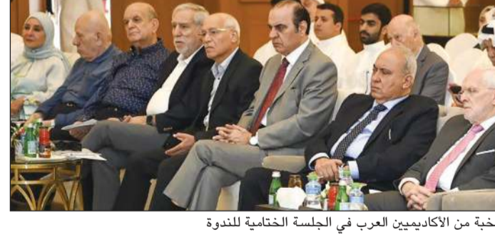
نخبة من الأكاديميين العرب في الجلسة الختامية للندوة