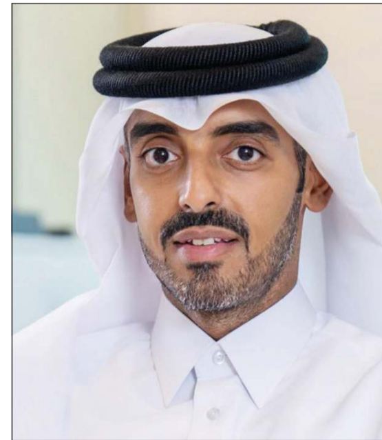
الشيخ ناصر آل ثاني