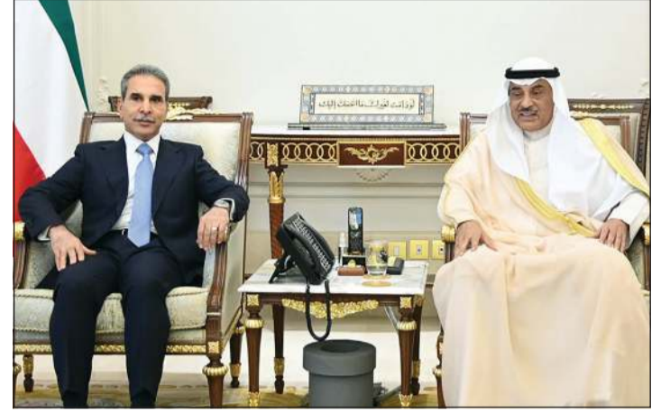
سمو ولي العهد الشيخ صباح الخالد مستقبلا رئيس مجلس القضاء الأعلى بجمهورية العراق د. فائق زيدان

من جانب آخر، بعث سمو ولي العهد الشيخ صباح الخالد ببرقية تعزية إلى الرئيسة دروبادي مورمو رئيسة جمهورية الهند الصديقة، ضمنها سموه خالص تعازيه وصادق مواساته بضحايا الهجوم الإرهابي الذي استهدف سياحا في بلدة باهالغام بإقليم كشمير، وأسفر عن سقوط العشرات من الضحايا وإصابة آخرين، متمنيا سموه لذوي الضحايا جميل الصبر والسلوان وللمصابين الشفاء العاجل.