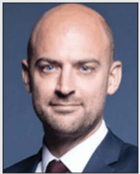
وزير الخارجية الفرنسي جان نويل بارو

«أ.ف.ب»: يصل وزير الخارجية الفرنسي جان نويل بارو، اليوم إلى البلاد قادما من العراق في إطار جولة إقليمية تشمل أيضا السعودية، وتأتي هذه الزيارة في وقت تعمل باريس على التحضير لمؤتمر حل الدولتين الذي ستترأسه بالإشتراك مع الرياض في مقر الأمم المتحدة في نيويورك في يونيو. ويسعى بارو من خلال جولته إلى الإعداد لمؤتمر حل الدولتين، وكذلك «مؤتمر بغداد الثالث للاستقرار الإقليمي».