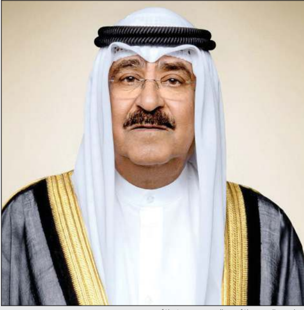
صاحب السمو الأمير الشيخ مشعل الأحمد