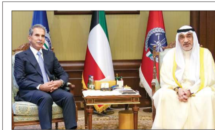
رئيس مجلس الوزراء بالإنابة الشيخ أحمد عبدالله مع مستقبلا رئيس مجلس القضاء الأعلى في العراق د. فائق زيدان

كونا: بعث سمو الشيخ أحمد عبدالله رئيس مجلس الوزراء ببرقية تعزية إلى الرئيسة دروبادي مورمو رئيسة جمهورية الهند الصديقة، ضمنها سموه خالص تعازيه وصادق مواساته بضحايا الهجوم الإرهابي الذي استهدف سياحا في بلدة باهالغام بإقليم كشمير.