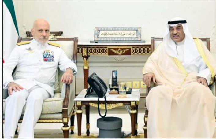
سمو ولي العهد الشيخ صباح الخالد خلال استقباله رئيس اللجنة العسكرية لحلف شمال الأطلسي الأدميرال جوزيبي كافو دراغون

كونا: بعث صاحب السمو الأمير الشيخ مشعل الأحمد ببرقية تعزية إلى الرئيسة دروبادي مورمو رئيسة جمهورية الهند الصديقة، عبر فيها سموه عن خالص تعازيه وصادق مواساته بضحايا الهجوم الإرهابي الذي استهدف سياحا في بلدة باهالغام بإقليم كشمير وأسفر عن سقوط العشرات من الضحايا وإصابة آخرين، راجيا سموه لذوي الضحايا جميل الصبر وحسن العزاء وللمصابين سرعة الشفاء.