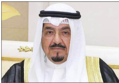
سمو الشيخ أحمد عبدالله رئيس مجلس الوزراء

كونا: بعث سمو الشيخ أحمد عبدالله رئيس مجلس الوزراء ببرقية تعزية إلى الرئيسة دروبادي مورمو رئيسة جمهورية الهند الصديقة، ضمنها سموه خالص تعازيه وصادق مواساته بضحايا الهجوم الإرهابي الذي استهدف سياحا في بلدة باهالغام بإقليم كشمير.