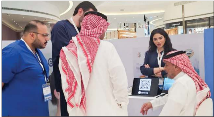
جانب من فعالية «الطوارئ» لتعزيز الوعي بالخطوات اليومية في «مول العاصمة»

والمعدات الضرورية داخل غرف الطوارئ، شاملة الأجهزة المنقذة للحياة مثل أجهزة تخطيط القلب، وأجهزة إزالة الرجفان الصدمات الكهربائية، بما يتماشى مع البروتوكولات العلاجية العالمية المعتمدة. وفي سياق تطوير البنية التحتية الرقمية، أعلنت عن تزويد غرف الطوارئ في مراكز الرعاية الأولية بأجهزة حاسوب حديثة، بهدف تسريع تسجيل البيانات وربطها آلياً بالملفات الطبية للمراجعين، مما