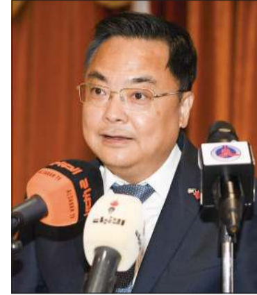
السفير الصيني تشانغ جيانوي

الصادرات الصينية، لافتاً إلى أن السياسات الأميركية تلقي معارضة حتى من حلفاء واشنطن الأوروبيين، الذين يرفضون ما وصفه بـ«النهج الأميركي المتعرج».