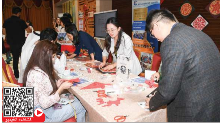
جانب من مهارات الرسم احتفالاً بالاحتفال باليوم العالمي للغة الصينية (قاسم باشا)