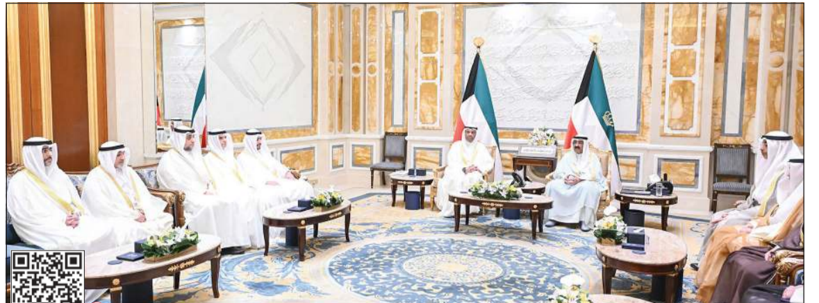
صاحب السمو الأمير الشيخ مشعل الأحمد خلال استقبال وزير الخارجية عبدالله الجحيا ورؤساء البعثات الدبلوماسية الجدد

صاحب السمو اطلع على خدمة المحادثة الذكية «مع حمد»