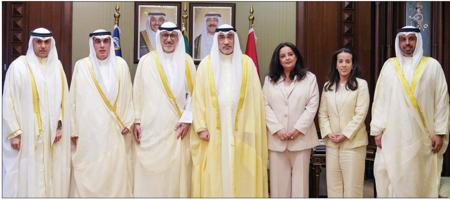
رئيس مجلس الوزراء بالإنيابة الشيخ فهد اليوسف مستقبلاً وزير التجارة والصناعة خليفة العجيل ورئيس مجلس مفوضي هيئة أسواق المال عماد أحمد تيفوني ونائب الرئيس ريان محمد الزيد والأعضاء طارق عبداللطيف والشهاب وحصه عبدالعزيز الرومي وثامر نبيل النصف

وزير التجارة والصناعة خليفة العجيل، حيث قدم له رئيس مجلس مفوضي هيئة أسواق المال عماد أحمد تيفوني، ونائب الرئيس ريان محمد الزيد، والأعضاء طارق عبداللطيف والشهاب وحصه عبدالعزيز الرومي وثامر نبيل النصف، وذلك بمناسبة تشكيل مجلس مفوضي هيئة أسواق المال. حضر المقابلة رئيس ديوان رئيس مجلس الوزراء عبدالعزيز الدخيل.