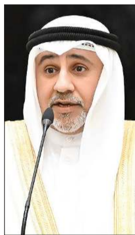
محمد طارق العريضان يؤدي القسم الدستوري سفيرا لدى أرمينيا