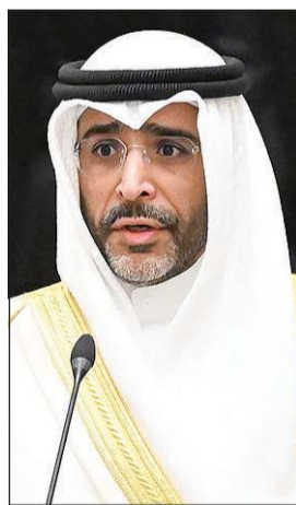
مشاري يوسف النجاري يؤدي القسم الدستوري سفيرا لدى الفلبين