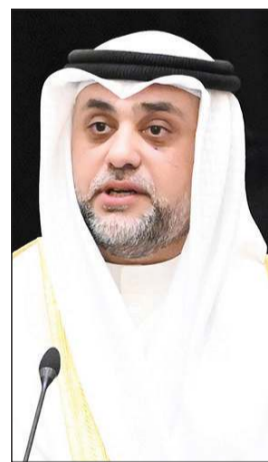
محمد يعقوب حياتي يؤدي القسم الدستوري سفيرا لدى مملكة السويد