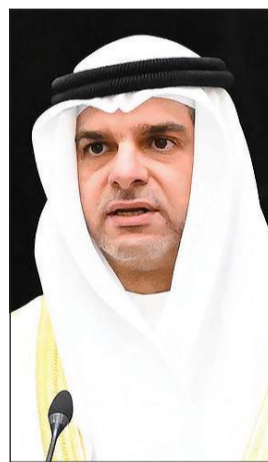
خالد جاسم الياسين يؤدي القسم الدستوري سفيرا لدى إندونيسيا