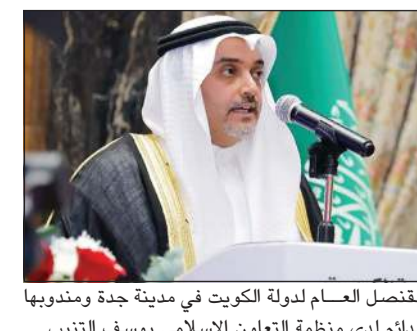
القنصل العام لدولة الكويت في مدينة جدة ومندوبها الدائم لدى منظمة التعاون الإسلامي يوسف التنيب

جدة - كونا: دعا القنصل العام لدولة الكويت في مدينة جدة ومندوبها الدائم لدى منظمة التعاون الإسلامي يوسف التنيب المواطنين الكويتيين إلى الالتزام بالقرارات والضوابط التي صدرت عن الجهات الرسمية السعودية بشأن موسم الحج لعام 1446 هجري. وقال القنصل التنيب في تصريح لـ (كونا) إن إعلان وزارة الداخلية السعودية يشير إلى إيقاف إصدار