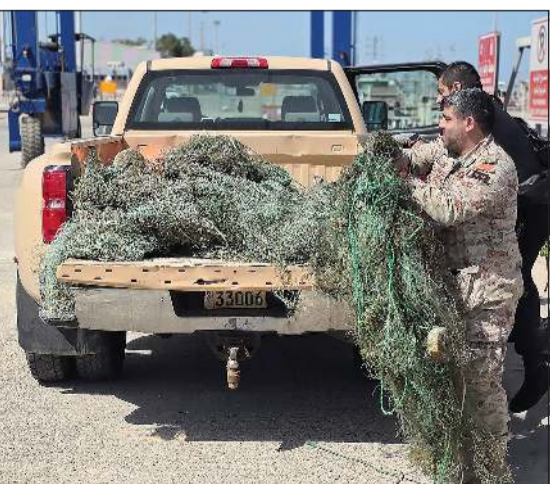
عناصر القوة البحرية لدى نقل الشباك بعد انتشالها

وتمثل العائق في شباك صيد مهمة بطول يقدر بنحو 500 متر، كانت عاقلة في قاع البحر وتشكل خطرا مباشرا على الشعاب المرجانية والكائنات البحرية.