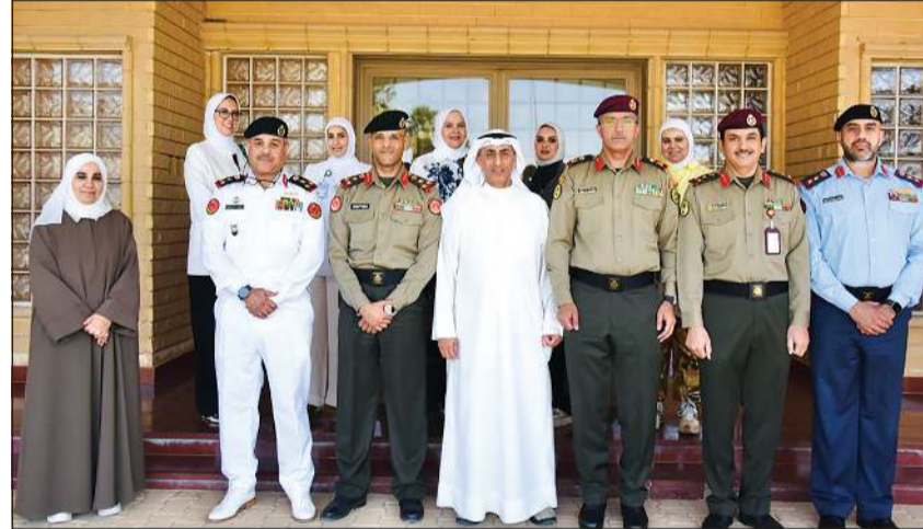
رئيس هيئة التعليم العسكري بالجيش العميد الركن جاسم العمانى ومساعد نائب مدير الخدمات الأكاديمية المساندة لخدمة المجتمع والكتبات بجامعة الكويت د.حامد الفريح مع عدد من حضور الاستقبال

كما تم خلال الاجتماع مناقشة عدة محاور تتعلق بالتدريب وبناء القدرات وتنمية المهارات الفنية والإدارية، بالإضافة إلى التطرق لاحتياجات الحرس