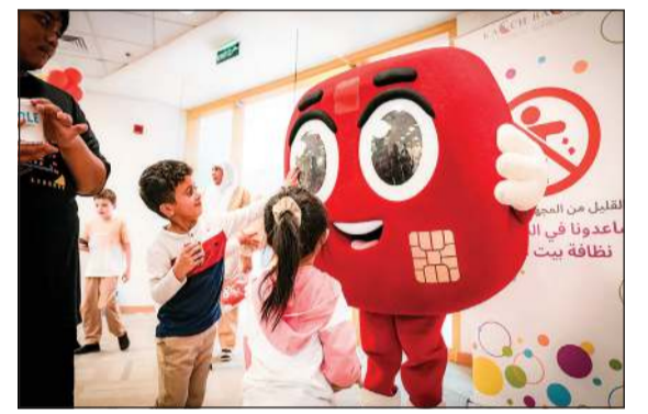
فرحة الأطفال مع تيمية حساب New

الأطفال الذين يمرضون بفقرات علاج صعبة في المستشفيات، إذ تضمن برنامج الزيارة العديد من الأنشطة المتعة والتعليمية التي تهدف إلى ترفيه الأطفال وتعليمهم. واشتملت الفعالية على ورش عمل حول الزراعة، حيث قام الأطفال بزراعة بعض النباتات بأنفسهم، مما أتاح