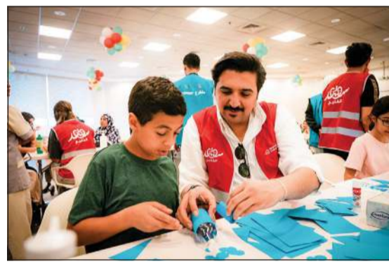
فريق سواعد الخليج يساعد الأطفال على قضاء وقت ممتع