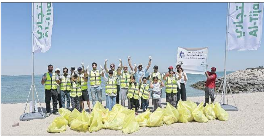
صورة جماعية لفريق البنك التجاري مع فريق الغوص

سلسلة المبادرات التي يقوم بها البنك التجاري ضمن حملة التحول الأخضر GO Green لتعزيز الوعي البيئي وتشجيع العمل التطوعي في مختلف المجالات، بما يعكس التزامنا العميق تجاه البيئة والمجتمع.