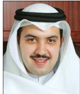
الشيخ مبارك العبدالله