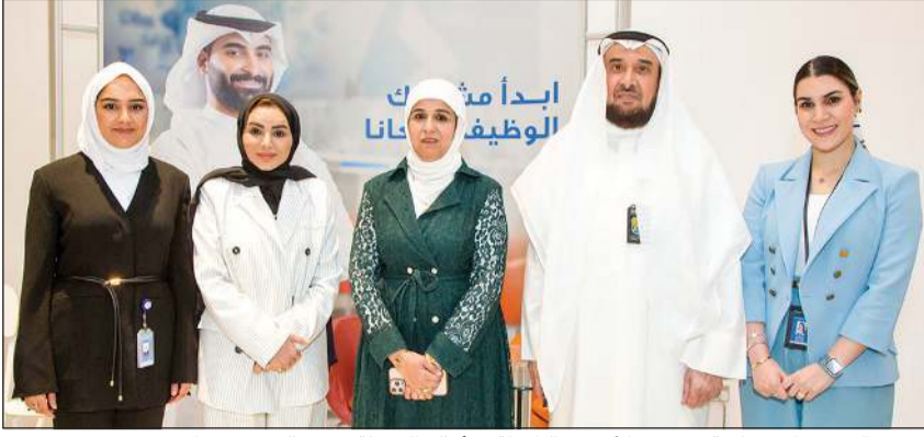
وزيرة الشؤون الاجتماعية وشؤون الأسرة والطفولة د. أمثال الحويطة مع ممثلي بنك برقان

في بنك برقان بان قوة مجتمعنا تبدأ من تمكن أفراد كافة دون استثناء، ولهذا نحرص على توفير فرص حقيقية تنمى لكل فرد أن يحقق طموحه ضمن بيئة داعمة وشاملة.