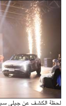
لحظة الكشف عن جيلي سيتي راي