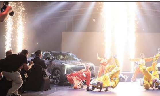
جانب من حفل الإطلاق

أمامية وخلفية وكاميرات برؤية محيطية 540 درجة. ولم تغفل «سيتي راي» عن تفاصيل الراحة، حيث توفر باب صندوق أمتعة ذكي يعمل بدون استخدام اليدين، إلى جانب مقاعد كهربائية مزودة بخاصية التدفئة والتبريد، ونظام تكيف CN95 لتنقية الهواء. كما تدعم السيارة 4 أوضاع قيادة هي: Eco، Comfort، Sport. Intelligent مختلف أنماط القيادة.