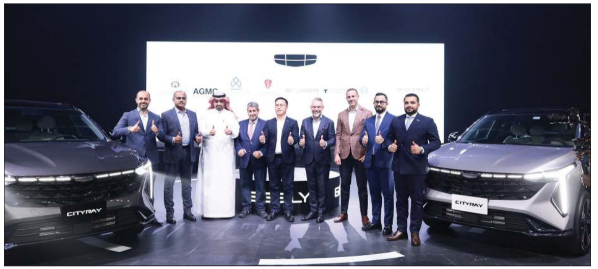
قيايدو مجموعة جيلي أوتو القابضة وجيلي الشرق الأوسط وأفريقيا إلى جانب فريق من الإدارة التنفيذية لشركة علي الغانم وأولاده للسيارات بعد الكشف عن السيارة الجديدة

أمامية وخلفية وكاميرات برؤية محيطية 540 درجة. ولم تغفل «سيتي راي» عن تفاصيل الراحة، حيث توفر باب صندوق أمتعة ذكي يعمل بدون استخدام اليدين، إلى جانب مقاعد كهربائية مزودة بخاصية التدفئة والتبريد، ونظام تكيف CN95 لتنقية الهواء. كما تدعم السيارة 4 أوضاع قيادة هي: Eco، Comfort، Sport. Intelligent مختلف أنماط القيادة.