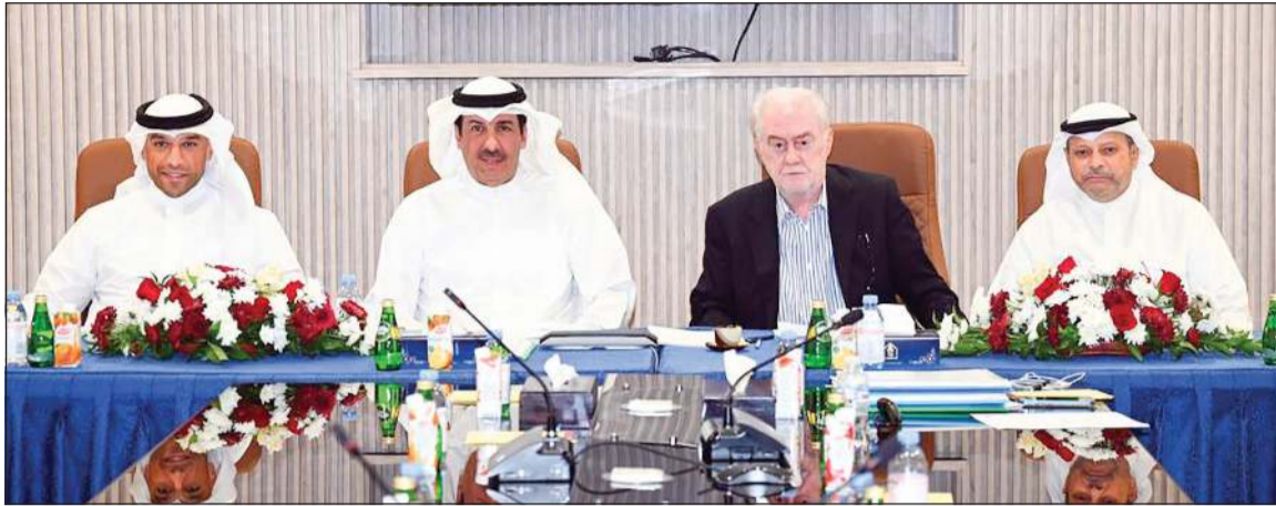
مرزوق الخرافي مترسدا الجمعية العمومية لشركة الصناعات الهندسية الثقيلة وبناء السفن

عقدت شركة الصناعات الهندسية الثقيلة وبناء السفن (سفن) جمعيتها العامة العادية الـ 5 في موعدها المحدد يوم الخميس الموافق 17 أبريل 2025، وذلك برئاسة رئيس مجلس الإدارة مرزوق الخرافي، بمقر الشركة الكائن في منطقة الشعبية الصناعية الغربية، حيث تمت الموافقة على جميع بنود جدول الأعمال والتي من ضمنها توزيع أرباح نقدية بنسبة 35٪ من رأس المال على مساهمي الشركة عن السنة المالية المنتهية في 31 ديسمبر 2024. وفي كلمته للجمعية العمومية، قال رئيس مجلس إدارة الشركة مرزوق الخرافي، إن الشركة تمكنت من تحقيق نتائج مميزة، إذ حققت خلال 2024 نموًا في الإيرادات التشغيلية بنسبة 11.1٪ لتصل إلى مبلغ 163.14 مليون دينار، وارتفع صافي الربح بنسبة 25.6٪ ليصل إلى 9.07 ملايين دينار، كما أن الشركة خلال عام 2024 حازت أقل الأسعار في بعض المناقصات إلا أن إجراءات الترسية والتعاقد لم تتم حتى وقتنا هذا. وأشار إلى أن قيمة الأعمال قيد التنفيذ حاليا من العقود المبرمة مع الشركة تبلغ 689 مليون دينار طبقا للموقف التنفيذي في 31 ديسمبر 2024، وسيتم إنجازها خلال 5 أعوام قادمة، ومن أهم العقود المبرمة هو عقد تحالف شركتنا مع شركة IHI Corporation اليابانية لتنفيذ مشروع تطوير وتحديث الغلايات البخارية وأنظمة التحكم في الوحدات الحرارية والأنظمة المساعدة في محطة الدوحة الغربية لتوليد القوى الكهربائية وتقطير المياه لصالح وزارة الكهرباء والماء والطاقة المتجددة بقيمة 173.18 مليون دينار. وأضاف أنه من المتوقع