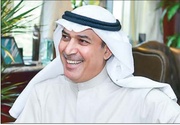
الكابتن عبدالحسن سالم الفقاعن

في وقت تتسابق فيه شركات الطيران الإقليمية والدولية على كسب ثقة المسافرين وتعزيز حصصها السوقية، تخلق شركة الخطوط الجوية الكويتية في مسار جديد من النمو المتسارع. مستندة إلى رؤية طموحة تحول الناقل الوطني من مجرد شركة طيران تقليدية إلى كيان مؤسسي يعكس هوية الكويت في سماء العالم بأسطول حديث، ووجهات متنوعة، وخدمات ذكية تواكب تطورات الجيل الجديد من المسافرين. تخطو «الكويتية» خطوات وثقة نحو المستقبل. اليوم ليست كما كانت... إنها شركة تعيد تعريف نفسها في زمن الطيران الذكي، وتنفق طريقتها بآليات تكون أكثر من مجرد ناقل وطني، بل واجهة حضارية تمثل الكويت في المحافل الدولية. رئيس مجلس الإدارة لشركة الخطوط الجوية الكويتية، الكابتن عبدالحسن سالم الفقاعن يكشف في لقاء خاص مع «الانباء» عن ملامح المرحلة المقبلة التي تخوضها الشركة. قال: «فازت الشركة إلى مصاف النخبة عالمياً. مهتلة المركز العشرين في تصنيف الأداء العالمي لعام 2024، والخامسة على مستوى العالم العربي، وفق بيانات مؤنفة صادرة عن موقع AirHelp؛ ومع إعلان تشغيل 12 وجهة جديدة خلال صيف 2025، وإطلاق أسطول يضم أحدث طرازات بوينغ وإيرباص. يؤكد الفقاعن أن «الكويتية» تتقدم نحواً فعلياً في تجربة السفر. بإرقام ومؤشرات يصعب تجاهلها، وسط بيئة تشغيلية متطورة ومعايير خدمة تنافس الأفضل في العالم. ويتابع الفقاعن: «نجاح الكويتية لم يتحقق في السماء فقط. بل أيضاً على الأرض. حيث خاضت الشركة مواجعة مباشرة مع التحديات الرقابية، ونجحت خلال عام واحد في معالجة عدد كبير من ملاحظات ديوان المحاسبة. من خلال لجان عمل مشتركة وخطط تصحيحية فورية، مع الالتزام الكامل بالأنظمة واللوائح المالية والإدارية.. وفيما يلي تفاصيل الحوار: