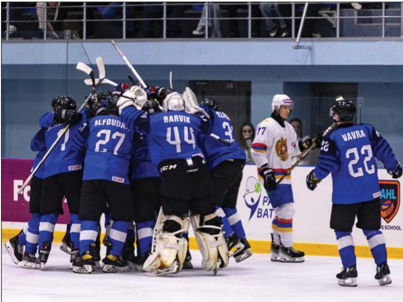
منتخبنا الوطني لهوكي الجليد حقق فوزاً ثميناً على أرمينيا