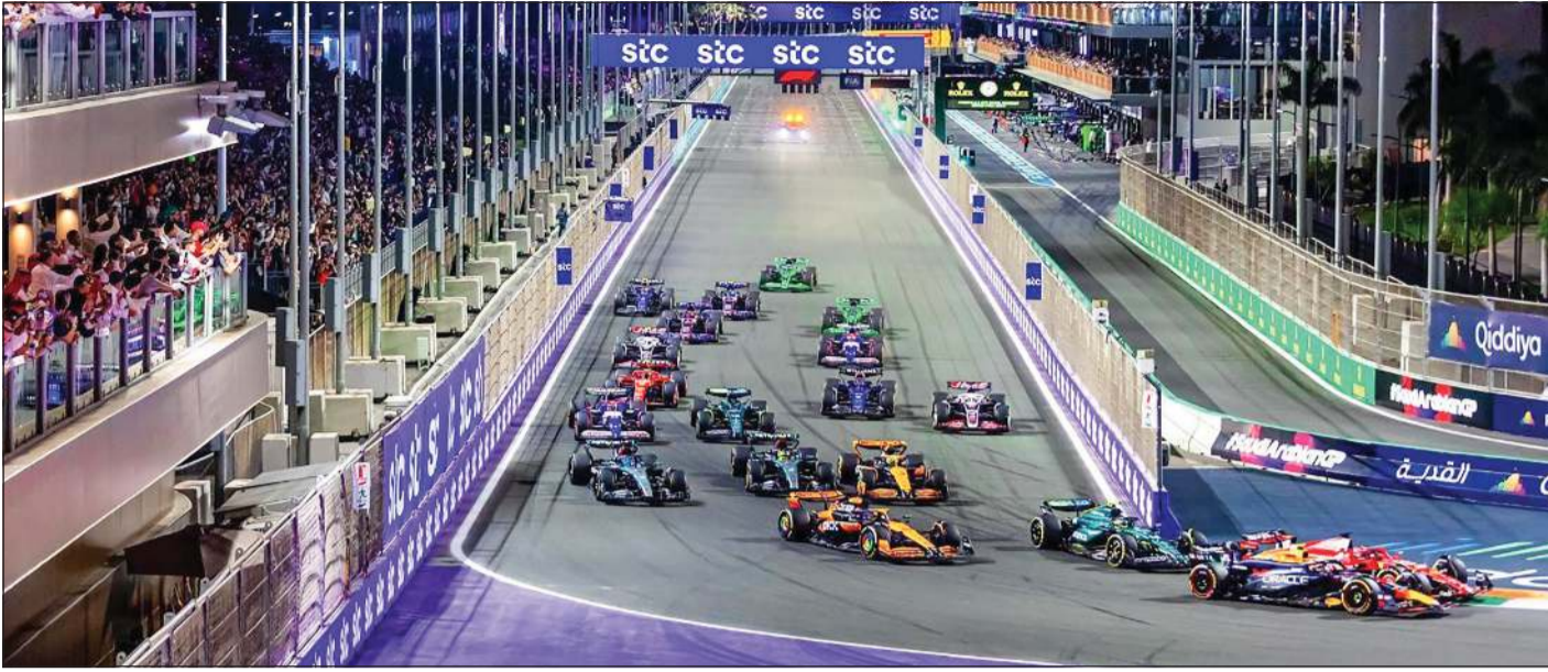
حلبة كورنيش جدة جاهزة لاستضافة الحدث الكبير

تتجه أنظار عشاق السرعة في العالم نحو حلبة كورنيش جدة التي تحتضن اليوم النسخة الخامسة من سباق جائزة السعودية الكبرى لـ (فورمولا 1) في واحدة من أكثر الفعاليات الرياضية العالمية ترقياً وجاذبية في رياضة المحركات الدولية. وبعد 4 أعوام من النجاحات المتتالية، تعيد جدة فتح أبوابها في الحلبة الموصوفة بأسرع حلبة شوارع في العالم والأكثر تميزاً، إذ تضم 27 منعطفاً، وهو عدد أكبر من أي حلبة أخرى في البطولة بمسار يمتد على مسافة 6,176 كيلومترات يتنافس فيها السائقون خلال الفترة من اليوم حتى بعد غد (الأحد) بسرعات قصوى مذهلة تصل إلى 322 كيلومتراً في الساعة. وشهدت الحلبة ذات التصميم الإنسيابي المقامة على ضفاف البحر الأحمر خلال النسخ السابقة لحظات فارقة في تاريخ البطولة، حيث دون البريطاني لويس هاميلتون اسمه باعتباره أول فائز في حلبة كورنيش جدة، تبعه الهولندي ماكس فيرستابن الذي فاز في النسختين الثانية والرابعة، في حين حصد المكسيكي سيرجيو بيرين لقب النسخة الثالثة، لتبقى الجولة السعودية في موسم سباق (فورمولا 1) شاهداً على تنافس قوي بين الأبطال العالميين. ويجسد استضافة جدة لسباق (فورمولا 1) للعام الخامس على التوالي رؤية المملكة العربية السعودية الطموحة إزاء استضافة أرقى الفعاليات العالمية، بما يعكس التحول المتسارع في القطاع الرياضي ويعزز مكانة السعودية باعتبارها وجهة رائدة على خريطة الرياضة الدولية. ويشهد موسم (فورمولا 1) لعام 2025 إقامة 24 سباقاً عبر 5 قارات بدأت في مارس الماضي بأستراليا وتنتهي في أبوظبي في ديسمبر المقبل. وأقيمت رابع جولات بطولة العالم لسباقات (فورمولا 1) موسم 2025 الأحد الماضي على حلبة البحرين الدولية، حيث توج فيها السائق الأسترالي أوكسار بياستري التابع لفريق (ماكلارين).