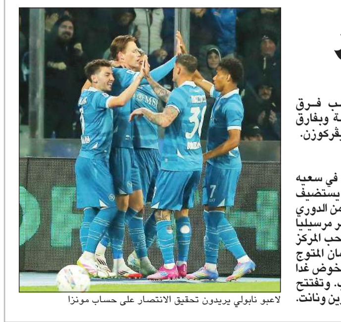
لاعبو نابولي يربدون تحقيق الانتصار على حساب مونزا

يأمل نابولي في تفادي مفاجآت مستضيفه مونزا عندما يلتقيه غدا السبت في انطلاق منافسات المرحلة الـ33 من الدوري الإيطالي لكرة القدم. ويحتل نابولي المركز الثاني برصيد 68 نقطة، بفارق 3 نقاط خلف المتصدر إنتر، فيما يمتلك مونزا 15 نقطة ويقع في المركز الـ20 الأخير. ويلتقي غدا أيضاً روما مع هيلاس فيرونا، ولتشتي مع كومو. ألمانيا تنتقل غدا منافسات المرحلة الـ30 من الدوري الألماني، حيث يلعب هايدنهايم مع بايرن ميونخ، وفرايبورغ مع هوفنهايم، ومامينتنس مع فولفسبورغ، ولايبزيغ مع هولستين كييل، وفيردر بريمن مع بوخوم،