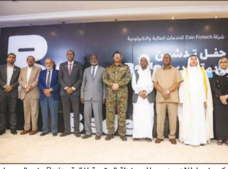
لقطة للمشاركة في إطلاق «زين» للمحفظة الرقمية المالية «Bede» في السودان

ومن المقرر أن يتم طرح «بيدي» Bede في السودان على ثلاث مراحل، حيث تتضمن المرحلة الأولى تحويل وتسليم الأموال، شحن الرصيد، سداد الفواتير، التسوق، والسحب والإيداع النقدي، وفي المرحلة الثانية سيتم ربط المحفظة بالبنوك السودانية الأخرى، وتوسيع الخدمات لتشمل شراء الكهرباء، سداد الرسوم الحكومية، وخدمات أخرى.