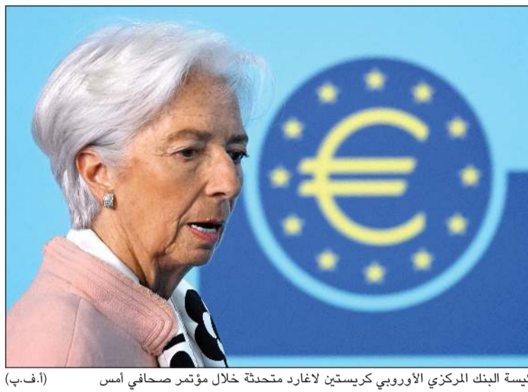
رئيسة البنك المركزي الأوروبي كريستين لاغارد متحدثة خلال مؤتمر صحفي أمس

وكالات: قرر البنك المركزي الأوروبي خفض أسعار الفائدة للمرة السابعة منذ يونيو 2024 بواقع 25 نقطة أساس إلى 2.4٪، وذلك بعدما هزت الرسوم الجمركية التي فرضها الرئيس الأميركي دونالد ترامب الأسواق وخيمت على التوقعات الاقتصادية. وقررت لجنة السياسة النقدية بالبنك المركزي الأوروبي خفض أسعار الفائدة الرئيسية الثلاثة بمقدار 25 نقطة أساس، متوافقة مع توقعات معظم المحللين في استطلاع «بلومبيرغ» للاقتصاديين الذين رجحوا خفض الفائدة على الإيداع إلى 2.25٪ من 2.5٪. وقال البنك إن عملية خفض التضخم تسير على المسار الصحيح، مع انخفاض كل من التضخم العام