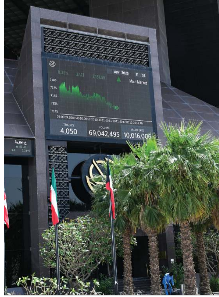
بورصة الكويت تنهي تداولات الأسبوع على أداء إيجابي وتحقيق مكاسب سوقية (متين غوزال)

الكويت بـ 13,49 مليون دينار. وعلى أساس يومي، أنهت بورصة الكويت جلسة تداولات أمس الخميس على ارتفاع جماعي في مؤشراتها مدفوعاً بعمليات شراء وبناء مراكز على العديد من الأسهم القيادية والتشغيلية في السوق الأول بقيادة الأسهم المصرفية مع عودة السيولة للارتفاع عند مستويات مستقرة نسبياً.