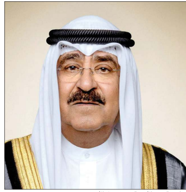
صاحب السمو الأمير الشيخ مشعل الأحمد

بعث صاحب السمو الأمير الشيخ مشعل الأحمد ببرقية تعزية إلى جلالة السلطان إبراهيم بن السلطان إسكندر ملك ماليزيا الصديقة، عبر فيها سموه الفقيد بوفاة المغفور له بإذن الله تعالى عبد الله أحمد بدوي رئيس وزراء ماليزيا الأسبق، سائلا سموه المولى تعالى أن يتغمد الفقيد بواسع رحمته ويسكنه فسيح جناته وأن يلهم الجميع جميل الصبر وحسن العزاء.