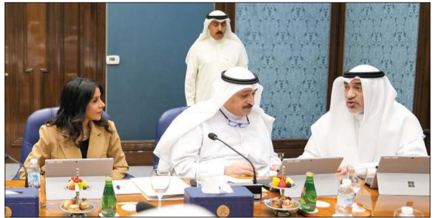
رئيس مجلس الوزراء بالإنيابة الشيخ فهد اليوسف وداحمد العوضي ودينورة المشعان