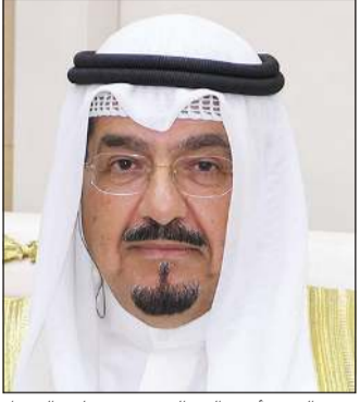
سمو الشيخ أحمد عبدالله رئيس مجلس الوزراء

بعث سمو الشيخ أحمد عبدالله رئيس مجلس الوزراء ببرقية تعزية إلى جلالة السلطان إبراهيم بن السلطان إسكندر ملك ماليزيا الصديقة ضمنها سموه خالص تعازيه وصادق مواساته لجلالته وللشعب الماليزي الصديق ولأسرة الفقيد بوفاة المغفور له بإذن الله تعالى عبد الله أحمد بدوي رئيس وزراء ماليزيا الأسبق.