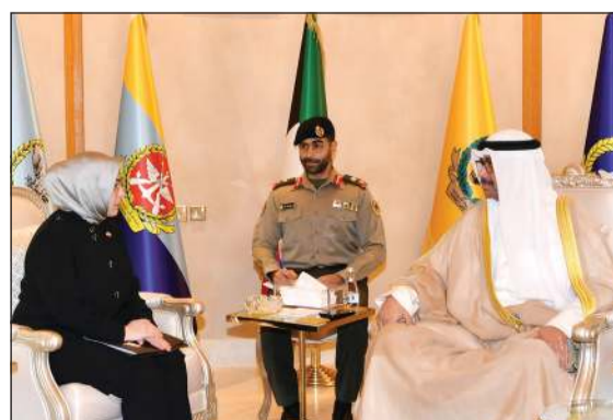
وزير الدفاع ووزير الداخلية بالإنيابة الشيخ عبدالله العلي مستقبلاً سفير تركيا طوبى سونمز

كونا: التقى وزير الدفاع ووزير الداخلية بالإنيابة الشيخ عبدالله العلي في مكتبه أمس الأربعاء - كلا على حده - سفيراً جمهورية تركيا الصديقة لدى البلاد طوبى سونمز وسفير جمهورية فرنسا الصديقة لدى البلاد أوليفيه غوفان. وذكرت وزارة الدفاع في بيان صحفي، أنه جرى خلال اللقاءين استعراض علاقات التعاون المشترك بين دولة الكويت والدول الصديقة وسبل تعزيزها في مختلف المجالات لاسيما في الجانب الدفاعية وآخر التطورات على الساحتين الإقليمية والدولية.