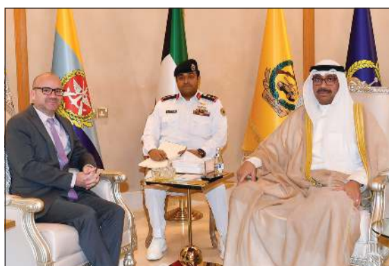
الشيخ عبدالله العلي مستقبلاً سفير فرنسا وأليفية غوفان