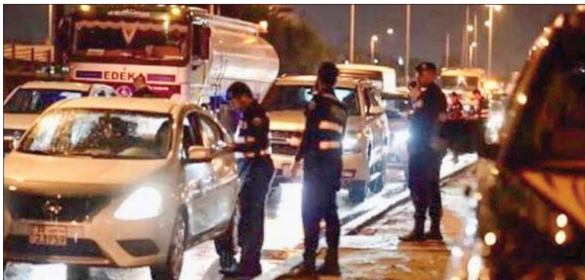
جانب من الحملة التي نفذتها الإدارة العامة للمرور