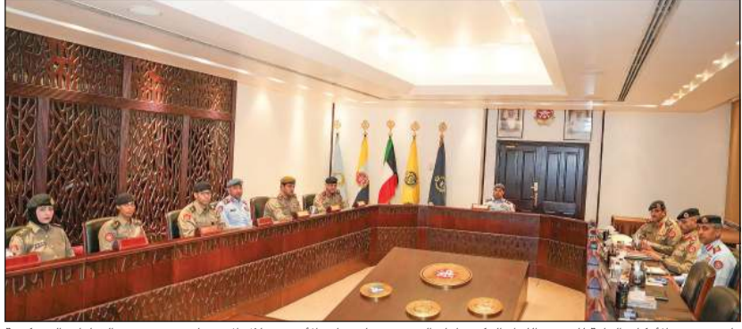
نائب رئيس الأركان العامة للجيش اللواء الركن طيار الشيخ صباح جابر الأحمد خلال الاجتماع مع عدد من القيادات العسكرية

أكد نائب رئيس الأركان العامة للجيش أن هذه الخطوة تأتي في سياق التحديث والتطوير الذي يشهده الجيش الكويتي، مشيداً بما يمكن أن تقدمه المرأة الكويتية من إسهامات نوعية في مختلف القطاعات العسكرية، مشيراً إلى أن المشروع في مراحله الأخيرة تمهيداً لبدء تنفيذ هذه الخطوة على أرض الواقع. حضر الاجتماع معاون رئيس الأركان لهيئة الإدارة والقوى البشرية، ورئيس هيئة القضاء العسكري، وأمر كلية علي الصباح العسكرية، ورئيس هيئة التعليم العسكري، وعدد من كبار الضباط.