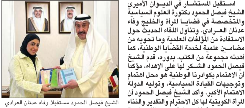
الشيخ فيصل الحمود مستقبلاً وفاء عدنان العرادي

استقبل المستشار في الديوان الأميري الشيخ فيصل الحمود دكتوراه العلوم السياسية والمتخصصة في قضايا المرأة والخليج وفاء عدنان العرادي. وتناول اللقاء الحديث حول الاستفادة من المؤلفات العلمية وما تحويه من مضامين علمية لخدمة القضايا الوطنية، كما أهدته مجموعة من الكتب. بدوره، قدم الشيخ فيصل الحمود الشكر لها على الإهداء، مؤكداً أن الاهتمام بكوارنا الوطنية هو محل اهتمام وتوجهات القيادة السياسية، وتوليه الدولة الاهتمام الأكبر. وأكد الشيخ فيصل الحمود أن المرأة الكويتية لها كل الاحترام والتقدير والثناء على جهودها، فكانت ومازالت وستظل صاحبة إنجازات مشرفة وعطاءات لا محدودة محل تقدير الدولة الكويتية، وعلى صعيد متصل، استقبل الشيخ فيصل الحمود الشاب الشيخ فهد فيصل الخليفة المالك الصباح، وتناول اللقاء الحديث حول الأفكار والمشروعات الشبابية