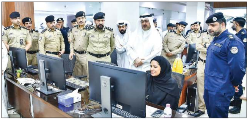
محافظ العاصمة الشيخ عبدالله سالم العلي خلال زيارته إلى الإدارة العامة للمرور

أكد محافظ العاصمة الشيخ عبدالله سالم العلي على أهمية تعزيز الوعي المروري بين الأفراد، وتسليط الضوء على أهمية الالتزام بقواعد المرور وما تتضمنه من ربط حزام الأمان وعدم استخدام الهاتف أثناء القيادة والذي يسهم في تقليل الحوادث المرورية ويضمن الحفاظ على سلامة الأرواح والممتلكات. جاء ذلك خلال الزيارة الميدانية التي قام بها محافظ العاصمة الشيخ عبدالله سالم العلي أمس إلى مبنى الإدارة العامة للمرور والتي تأتي بالتزامن مع دخول قانون المرور الجديد حيز التنفيذ يوم 22 الجاري وبالتزامن مع انطلاق فعاليات أسبوع المرور الخليجي الموحد 38 تحت شعار «قيادة.. بلا هاتف»، حيث كان في استقباله مدير عام الإدارة العامة للمرور العميد جمال الفودري وعدد من القيادات الأمنية. واطلع المحافظ خلال الزيارة على سير