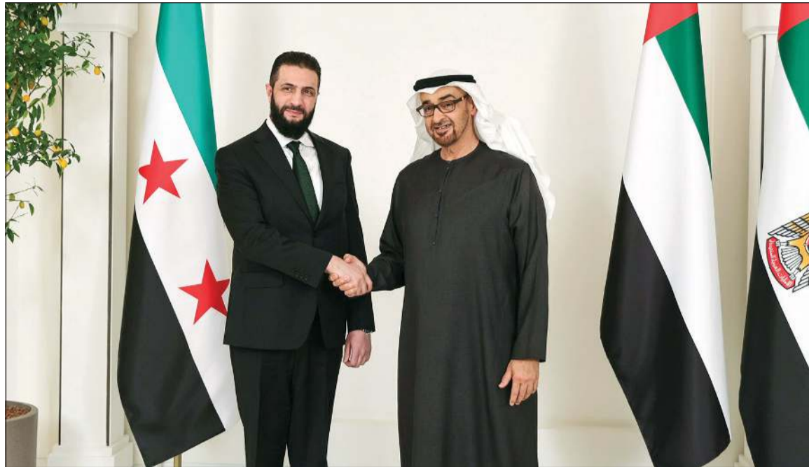
صاحب السمو الشيخ محمد بن زايد آل نهيان رئيس دولة الإمارات مستقبلاً الرئيس السوري الانتقالي أحمد الشرع

وكالات: أكد وزير الخارجية التركي هاكان فيدان أن عمليات التوغل الإسرائيلية في سورية تثير الاستفزازات وتخلق حالة من عدم الاستقرار. وشدد فيدان خلال مؤتمر صحافي في ختام أعمال منتدى أنطاليا الدبلوماسي أمس، على احترام سيادة سورية ووقف الانتهاكات الإسرائيلية في الأراضي السورية. وأعرب فيدان عن دعم بلاده للحكومة السورية الجديدة لتحقيق الأمن والاستقرار ومكافحة الإرهاب. وقال إن بلاده تعارض التهديدات الموجهة إلى سورية، مؤكداً مواصلة الدفاع عن الدبلوماسية. وتطرق الوزير التركي للمباحثات التركية مع إسرائيل في أذربيجان، حول سورية، وبين أنه حتى لا يقع أي صراع بين الأطراف في سورية، سواء كانت إسرائيلية أو أميركية، حول أي قضية، فلا بد من تحديد القواعد ومنع الصراع.