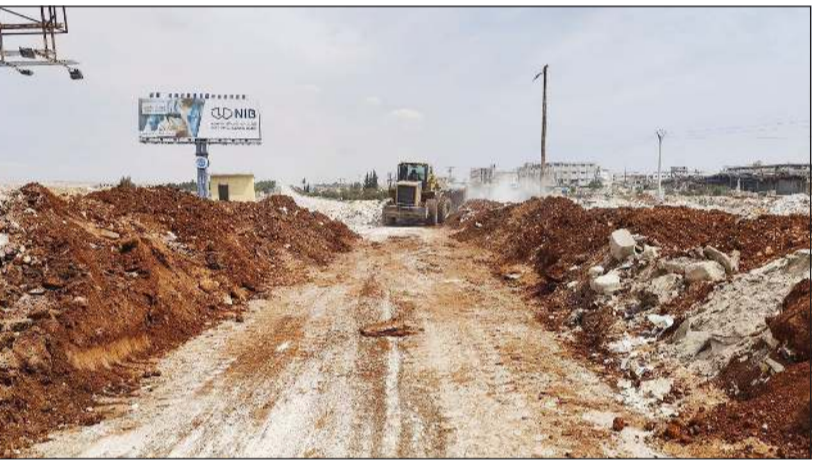
آليات تقوم بفتح الطرقات المؤدية إلى حيي الأشرفية والشيخ مقصود في حلب

التابعة لقوات سوريا الديمقراطية «قسد» الكردية، لتعزيز الأمن في المنطقة. وذكرت «سنا»، أنه تم فتح الطرقات المؤدية إلى حيي الأشرفية والشيخ مقصود في حلب، تنفيذاً لاتفاق الموقع بين الحكومة السورية و«قسد».