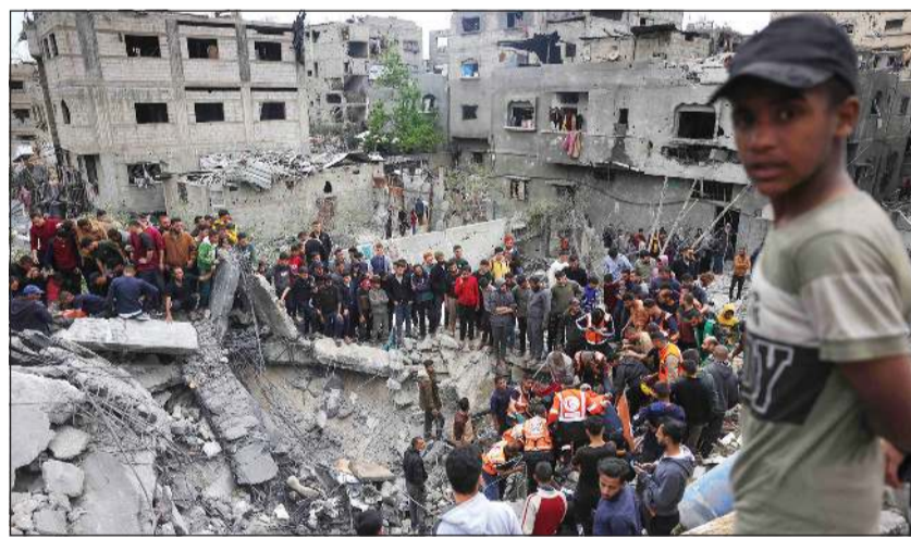
فلسطينيون يتجمعون على أنقاض المنازل المدمر جراء غارة إسرائيلية في جباليا شمال قطاع غزة