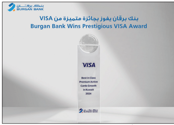
جائزة «الأعلى نمواً بفتته في البطاقات المميزة»