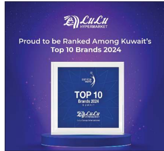
حصلت «لولو هايبر ماركت»، سلسلة التجزئة الرائدة في المنطقة، على أعلى تكريم في جوائز مؤشر رضا العملاء من خدمة هيرو الرموزة، حيث فازت بجائزة «أفضل 10 علامات تجارية لعام 2024»، ويسلط هذا التقدير الضوء على تميز لولو في خدمة العملاء ويعزز التزامها بتجاوز توقعات المتسوقين في جميع نقاط الاتصال.

وتم تكريم لولو هايبر ماركت مرة أخرى من قبل منصة خدمة هيرو، ما يبرز التفاني المستمر للعلامة التجارية في تقديم خدمة متميزة ورضا العملاء.