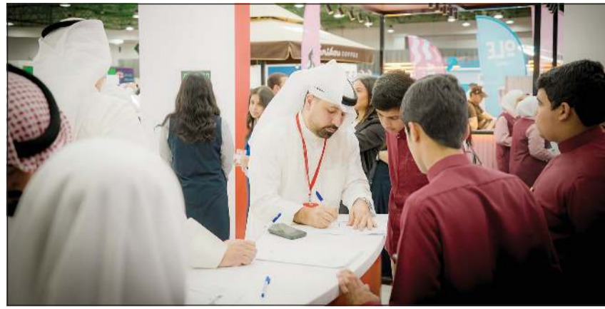
إقبال لافت من الطلاب على جناح بنك الخليج

متعددة، من خلال الشراكات الاستراتيجية مع العديد من الجمعيات والجهات الداعمة للشباب، وتوفير فرص وتدريب للمواهب والكفاءات، وتلبية لمتطلبات مختلف المجالات. من خلال رعايته للفعاليات التعليمية والمهنية، يلتزم بنك الخليج بتوفير بيئة تعليمية محفزة للشباب، من خلال تعزيز دورهم في بناء مستقبلهم المهني وتحقيق طموحاتهم وتمكينهم في مجالات