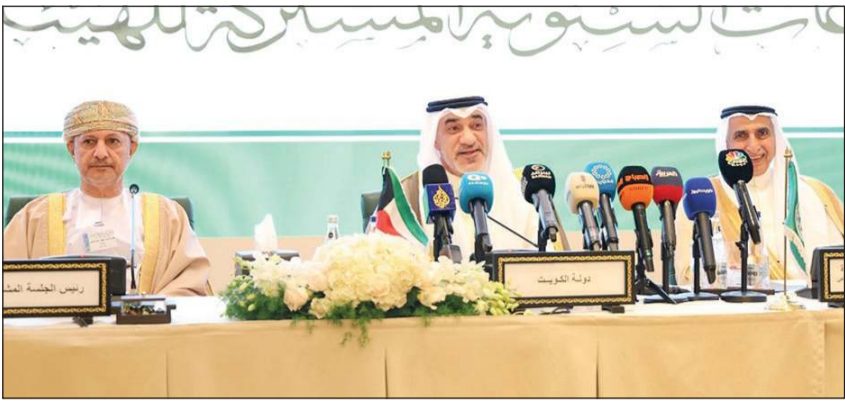
رئيس مجلس الوزراء بالإنابة الشيخ فهد اليوسف خلال الاجتماعات السنوية المشتركة للهيئات المالية العربية

التنمية في الوطن العربي، المقدمة من الصندوق العربي للإنماء الاقتصادي والاجتماعي. ونال الجائزة صندوق أبوظبي للتنمية لمشروع توسعة وتطوير مطار البحرين الدولي» في مملكة البحرين كأفضل مشروع تنموي اقتصادي واجتماعي في الدول العربية.