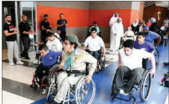
انطلاق مسابقة «الجرى» على الكراسي المتحركة

من ذوي الإعاقات المتنوعة أنشوا كبرى فيه محققين إنجازات لافتة تحسب لرصيد الرياضة الكويتية. وتنوع الرياضات في هذا اليوم المفتوح لذوي الإعاقات الحركية بمشاركة عدد من أبطال الكويت من ذوي الإعاقة الذين حققوا إنجازات بارزة في هذا المجال بين لعبة التنس و«البوتشا» ولعبة الريشة التي لاقت تفاعلا كبيرا من المشاركين وأولياء أمورهم، إلى جانب تشجيع مربيهم، ما كان له الأثر في تفاعلهم واجتهادهم استحقاقا عليه في نهاية الفعالية الرياضية جوائز تكريمية.