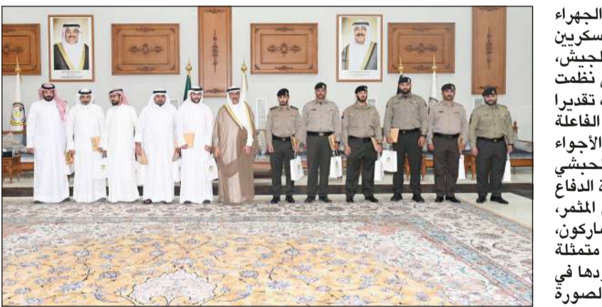
محافظ الجهراء حمد الحبشي مع المكرمين خلال الاحتفال