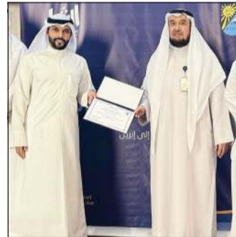
تكريم أحد المشاركين

في إطار حرصها على نشر الوعي الثقافي بين الطلبة وتعزيز القيم الشبابية والفكرية، نظمت الهيئة العامة للشباب بالتعاون مع عمادة شؤون الطلبة ممثلة في القسم النقابي، سلسلة من 7 محاضرات ضمن فعاليات الأسبوع الثقافي التوعوي، وذلك في يومي الإثنين والأربعاء في مختلف كليات جامعة الكويت. تناولت المحاضرات العديد من القيم للطلاب للاستفادة منها في حياته العملية والعلمية الحالية والمستقبلية، حيث تم تسليط الضوء على مهارات تصقل قيم ومهارات الطلبة من خلال محاضرات توعوية وترفيهية تعليمية. كما قدم المحاضرون مجموعة من النصائح والتوجيهات العملية التي تساعد الأفراد على الاستثمار في حياتهم بأفضل صورة ممكنة.