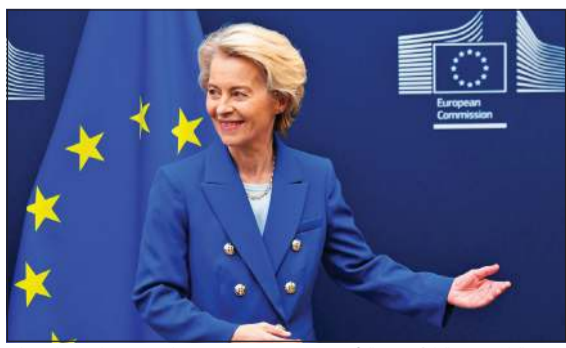
رئيسة المفوضية الأوروبية أورسولا فون دير لاين تلوح بيدها قبل اجتماع في مقر المفوضية الأوروبية أمس

والضرائب. وبحسب التعديل، ستفرض الولايات المتحدة ضريبة على الواردات التي لا تتجاوز 800 دولار بنسبة 90% من قيمتها، وبعزت الخطة السابقة التي كانت تقضي بفرص ضريبة بنسبة 30%. وكان من المقرر أن تنتهي الإعفاءات الضريبية على السلع منخفضة القيمة في الثاني من مايو، غير أن الزيادة الأخيرة جاءت رداً على الإجراءات الانتقامية التي اتخذتها بكين بعد جولة سابقة من الرسوم فرضها ترامب. كما سترفع واشنطن الرسوم المفروضة على كل طرد بريدي يدخل الشركة قد تعهدت في وقت سابق ببناء مصانع جديدة لها داخل البلاد. وفي خطوة تصعيدية جديدة ضمن الحرب التجارية بين الولايات المتحدة والصين، قرر ترامب رفع الرسوم الجمركية على الطرود الصغيرة التي كانت حتى الآن معفاة من