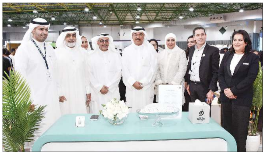
وزير التربية م.سيد جلال الطيباني خلال زيارته جناح جامعة عبدالله السالم في معرض «دراستي»

في الكويت، مشيراً إلى أن هذا التجمع يعد فرصة مثالية لطلاب وطالبات المدارس الثانوية في دولة الكويت للاطلاع على أحدث التخصصات التي تقدمها الجامعات، خاصة جامعة عبدالله السالم التي تعتبر واحدة من الجيل الرابع وتقدم تخصصات فريدة تلاحق احتياجات سوق العمل الحالية والمستقبلية، والتي تقدم فرصاً لم تكن متاحة في السابق.