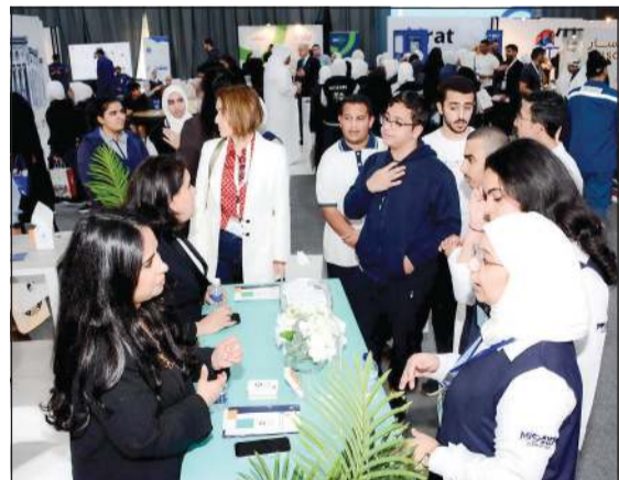
الطلبة خلال زيارتهم جناح الجامعة

في الكويت، مشيراً إلى أن هذا التجمع يعد فرصة مثالية لطلاب وطالبات المدارس الثانوية في دولة الكويت للاطلاع على أحدث التخصصات التي تقدمها الجامعات، خاصة جامعة عبدالله السالم التي تعتبر واحدة من الجيل الرابع وتقدم تخصصات فريدة تلاحق احتياجات سوق العمل الحالية والمستقبلية، والتي تقدم فرصاً لم تكن متاحة في السابق.