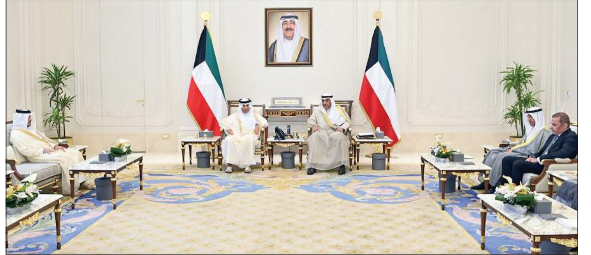
سمو ولي العهد الشيخ صباح خالد مستقبلاً سفير دولة قطر علي بن عبدالله آل محمود بحضور مدير مكتب سمو ولي العهد الفريق متقاعد جمال الذياب ووكيل الشؤون الخارجية بديوان سمو ولي العهد مازن العيسى

حضر اللقاء مدير مكتب سمو ولي العهد الفريق متقاعد جمال محمد الذياب ووكيل الشؤون الخارجية بديوان سمو ولي العهد مازن العيسى.