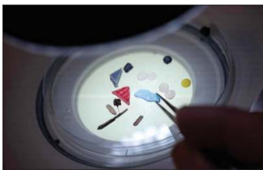
تحليل حبيبات بلاستيكية دقيقة في مختبر جامعة بليموث