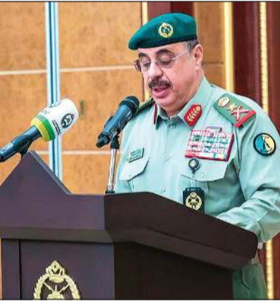
وكيل الحرس الوطني الفريق الركن م. هاشم الرفاعي يلقي كلمة