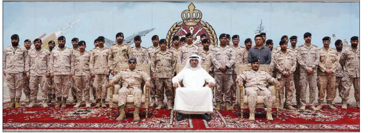
وزير الدفاع ووزير الداخلية بالإنابة الشيخ عبدالله العلي ونائب رئيس الأركان العامة للجيش اللواء الركن طيار الشيخ صباح جابر الأحمد خلال زيارة هيئة الإمداد والتموين في منطقة صباح