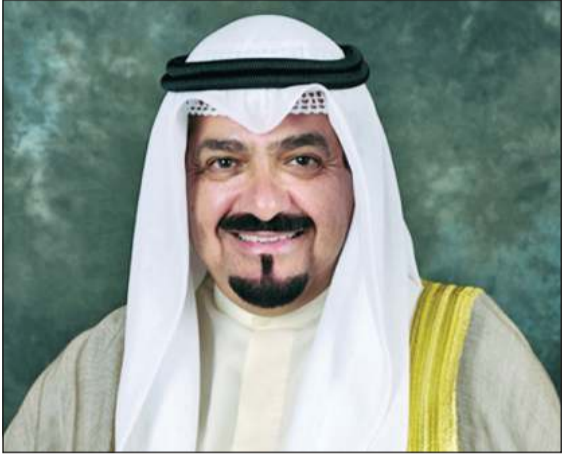
سمو الشيخ أحمد عبدالله رئيس مجلس الوزراء

علاقات صداقة تاريخية تربط الكويت وألمانيا وتعاون بناء ورؤى مشتركة لترسيخها وتنميتها رغبة جادة في تعزيز الشراكة الإستراتيجية وتنويع الفرص الاستثمارية مع ألمانيا