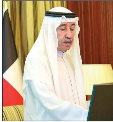
رئيس الحرس الوطني الشيخ مبارك الحمد خلال تدشين الخطة الإستراتيجية الرابعة للحرس الوطني

دشّن رئيس الحرس الوطني الشيخ مبارك الحمد الخطة الإستراتيجية الرابعة للحرس الوطني (2030) تحت شعار «حماية وطن».