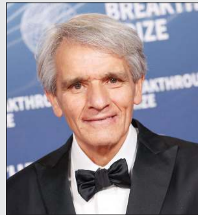
طبيب الأعصاب الأميركي ستيفن هاووز الحاصل على جائزة أوسكار العلوم

ومن خلال أبحاثه مع زملائه على قروود الماروسيت (قروود القشّة)، تمكن من إعادة إنتاج آفات عصبية مطابقة لتلك التي تسجل لدى البشر، وذلك بفضل فكرة أحد زملائه لدراسة دور الخلايا اللمفاوية البائية، وهي نوع آخر من خلايا الدم البيضاء. وفي صيف عام 2006، ظهرت النتائج، وتبين أن الأدوية التي أعطيت للمرضى