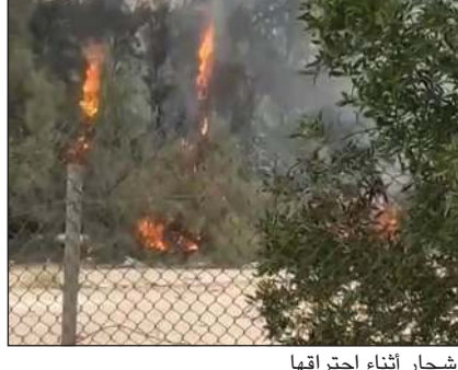
الأشجار أثناء احتراقها

تعامل رجال قوة الإطفاء العام مع حريق أشجار في محافظة الجهراء وتحديداً مقابل أحد الأسواق الشهيرة. وقال مصدر أمني إن بلاغاً ورد أول من أمس عن حريق أشجار، وعلى الفور توجه رجال الإطفاء والدوريات، وتم التعامل مع الحريق الذي لم يخلف أي إصابات ودون أن تعرف الأسباب التي أدت إلى اشتعال النيران.