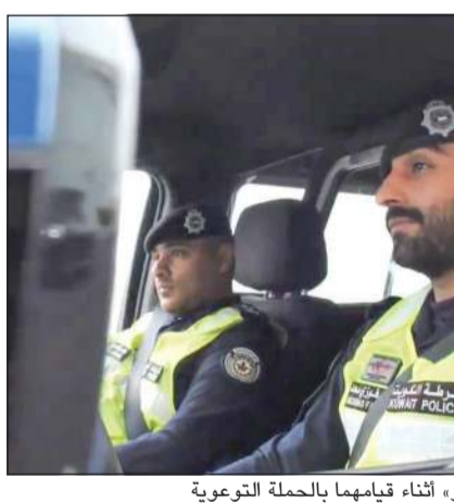
شرطة من «المرور» أثناء قيامها بالحملة التوعوية

قام فريق من قطاع المرور بتوزيع منشورات تخص التوعية المرورية حول تعديلات قانون المخالفات الذي سيتم تطبيقه خلال هذا الشهر. وقال مصدر أمني إن مجموعة من الضباط وضباط الصف بقطاع المرور نفذوا حملة توعوية بمعظم محافظات البلاد، حيث يقوم رجال المرور بتوقيف قائدي المركبات، وبدلاً من إصدار مخالفات بحقهم يقومون بإعطائهم منشورات تخص تعديلات المخالفات بمختلف اللغات. وأكد المصدر أن قطاع المرور كنف الحملات التوعوية حول انطلاق قانون المرور الجديد الذي يحد من الاستهتار واستخدام الهاتف وحماية أرواح الناس، وضرورة الالتزام