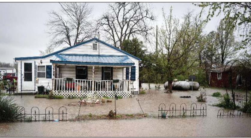
المياه حاصرت المنازل في «ميسوري» بسبب الأمطار الغزيرة

جراء العاصفة في ولايات عدة، حيث دمرت منازل واقتلعت الأشجار وقطعت خطوط الكهرباء وانقلبت السيارات. أن «الناس والممتلكات في خطر كبير».