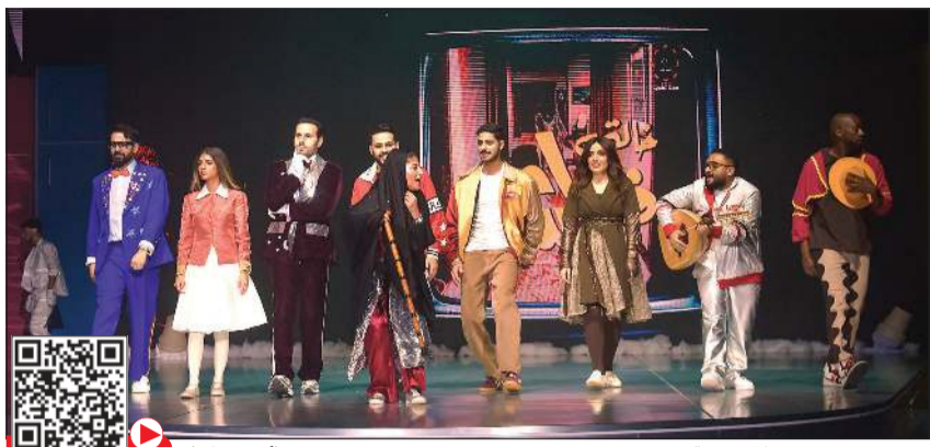
مشهد يجمع نجوم المسرحية