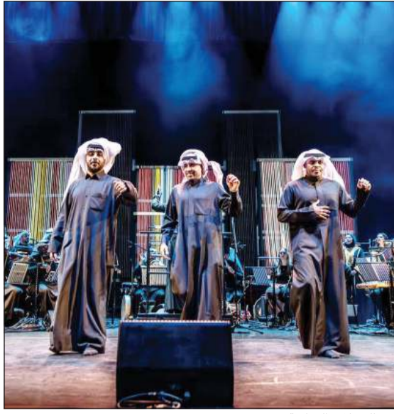
من الحفلات السابقة