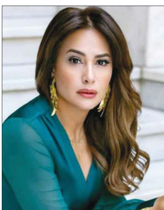
القاهرة - محمد صلاح

الأمر الذي انتشر سريعا وتداوله رواد مواقع التواصل الاجتماعي. من جهة أخرى، تستعد هند صبري للتعاون مع الفنان أحمد حلمي في فيلم جديد، وصفته بالمفاجأة، وتكتمت تماما حول سرده قصته، مؤكدة أنها مفاجأة غير مسبوقه، وقالت عن هذه التجربة: «متشوقة جدا لتجربتي مع أحمد حلمي خاصة أنه الوحيد الذي لسه ما اشتغلنا معه يعني اشتغلنا أنا وكريم عبدالعزيز وأحمد عز وأحمد السقا، كمان محمد هنيدي اشتغلنا سوا في الإذاعة، وفيلمه الذي جاي معاه هيكون مفاجأة وما أقدرش أقول غير كده، أنا عمري ما قرئت سيناريو زي ده، وهو عمل مش متوقع بالرة ويعتبره أغرب فيلم اشتغلنا فيه».