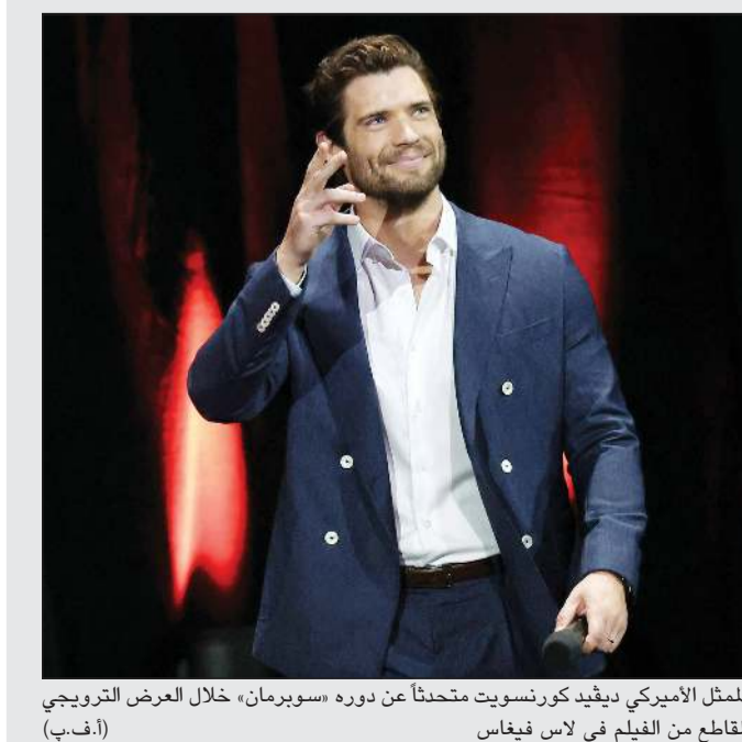
الممثل الأميركي ديفيد كورنوسويت متحدثاً عن دوره «سوبرمان» خلال العرض الترويجي لمقاطع من الفيلم في لاس فيغاس

ووعد المخرج جيمس غان بمنظور جديد على الشخصية «التي ينظر إليها كثيرون على أنها غير مواكبة للعصر». وسيؤدي الممثل الأميركي ديفيد كورنوسويت دور سوبرمان بالفيلم الجديد. وظهر أحد العناصر الأساسية في الفيلم وهو كلب البطل الخارق «كريبتو»، في مشاهد كثيرة عرضت خلال الملثقي. وقال جيمس غان: «هذا الفيلم يحتفي باللطف والحب الإنساني». ومن الأفلام الأخرى التي تعمل عليها «وارنر» «وان باتل أفر انانز» another one battle after another ليويل توماس أندرسون، ومن بطولة ليوناردو دي كابريو. والفيلم الذي تخطت تكلفته 140 مليون دولار مستوحى من رواية «فينلاندا» للكاتب توماس بينشون، والتي تدور أحداثها في كاليفورنيا خلال ثمانينيات القرن العشرين.