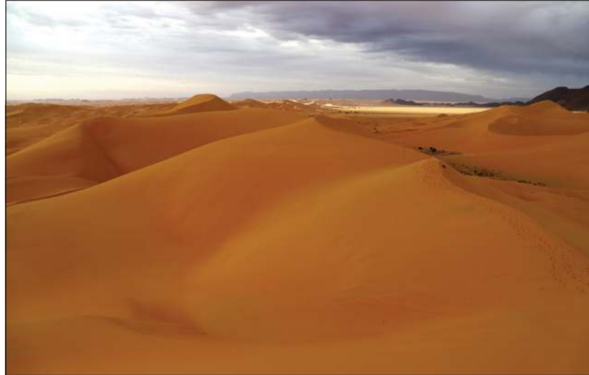
شروق الشمس على كثبان صحراء تيزييه وهي جزء من «الصحاري» بين النيجر وتشاد