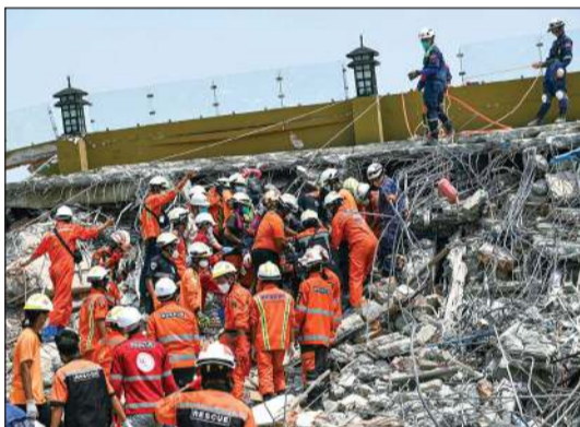
رجال الإنقاذ يحملون جثة ضحية جراء الزلزال في ميانمار (أ.ف.ب)

يانغون - شينخوا: تم إنقاذ موظف فندق بالغ من العمر 26 عاماً من تحت أنقاض مبنى فندق منهار في ناي بي تاو بميانمار أمس، وذلك بعد 5 أيام من الزلزال الذي ضرب البلاد بقوة 7,9 درجات على مقياس ريختر، حسبما أفاد فريق استعلامات مجلس إدارة الدولة في البلاد. وقال الفريق إن شخصين كانا تحت الانقاض، لكن نجحت فرق الإنقاذ من إدارة الإطفاء في ميانمار وتركيا، في انتشال أحدهما. وأوضح أنه تم إنقاذ الرجل، مؤكداً أن الجهود اللازمة لتحديد مكان المحاصرين المتبقين وإنقاذهم مازالت جارية.