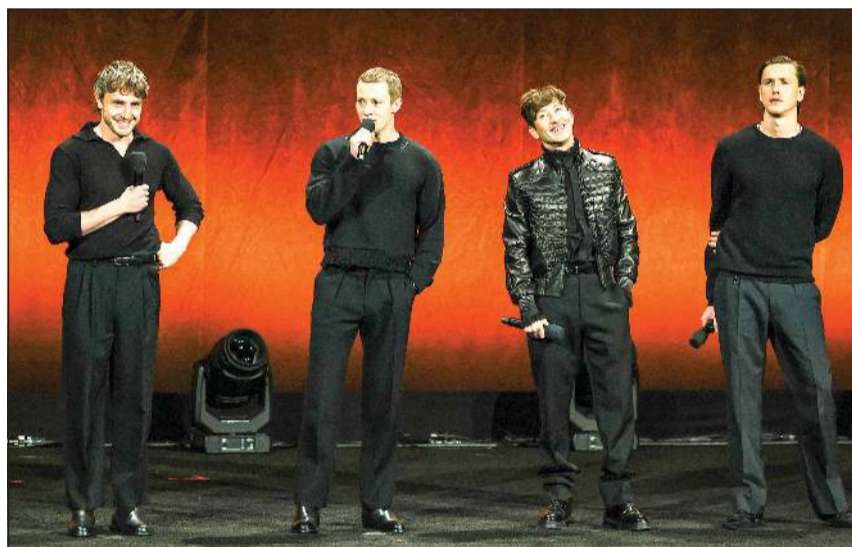
بول ميسكال وجوزيف كوين وباري كيوغان وهاريس ديكسون خلال الترويج لأفلام عن فرقة البيتلز

لاس فيغاس - أ.ف.ب: أعلن المخرج سام مينديز أن أربعة أفلام تتمحور على أعضاء فرقة البيتلز ستطرح عام 2028. وسيؤدي بول ميسكال دور بول مكارتني، فيما سيؤدي باري كيوغان دور رينغو ستار في «أول تجربة سينمائية متعة». ويركز كل فيلم من المجموعة التي يبدأ عرضها في دور السينما خلال أبريل 2028، على عضو من فرقة البوب البريطانية الأسطورية، إذ سيؤدي هاريس ديكسون دور جون لينون وجوزيف كوين دور جورج هاريسون.