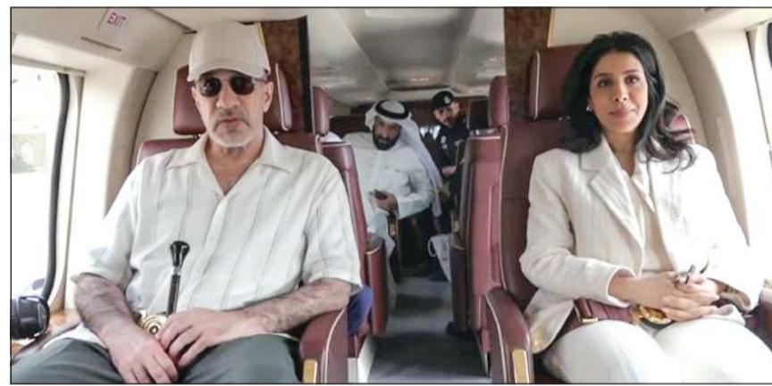
رئيس مجلس الوزراء بالإنابة الشيخ فهد اليوسف ووزيرة الأشغال العامة د.نورة المشعان تجولا على المنافذ الحدودية بطائرة عمودية

الترقيات تأتي في إطار حرص وزارة الداخلية على دعم منتسبيها وتحفيزهم لبذل المزيد من الجهد في تعزيز المنظومة الأمنية، وحرص وزارة الداخلية على تقدير جهود منتسبيها من أعضاء قوة الشرطة، وحثهم على بذل المزيد من الجهد والعباءة وتعزيز كفاءة العمل الأمني في البلاد.