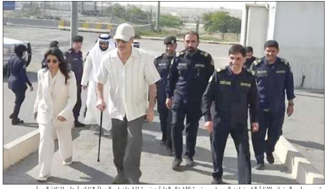
رئيس مجلس الوزراء بالإنابة الشيخ فهد اليوسف ووزيرة الأشغال العامة د.نورة المشعان في الجولة التفقدية على المنافذ البرية

خلال تفقد رئيس مجلس الوزراء بالإنابة برفقة وزيرة الأشغال العامة منافذ العبدلي والسالمي والنويص