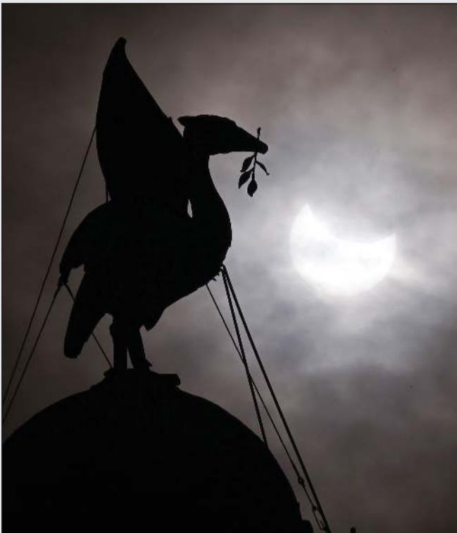
الكسوف الجزئي أمام تمثال ليغر بيرد الشهير في ليغربول