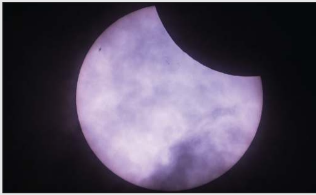
القمر يمر أمام قرص الشمس خلال الكسوف الجزئي كما ظهر في برلين

مثالية بما يكفي ليلمس مخروط الظل سطح الأرض، وسيبقى في الفضاء» لذلك لم يكن هناك كسوف كلي في أي مكان وفي أي وقت، على ما يوضح ديليفلي. ويمكن لأشعة الشمس القوية أن تسبب حروقا في العين وتؤدي إلى أضرار دائمة. من الضروري الحصول على نظارات خاصة لمعاينة الكسوف والتأكد من أنها في حالة ممتازة.