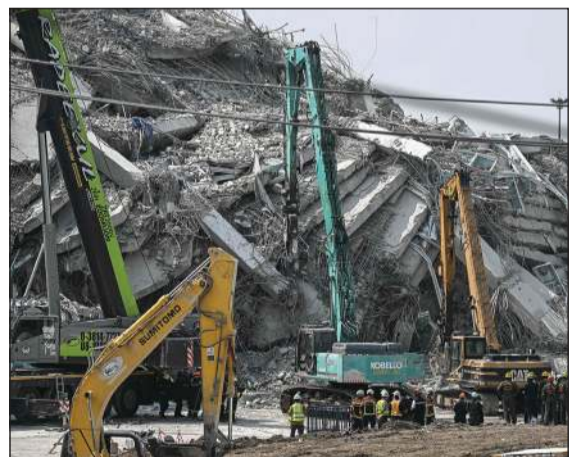
آليات ثقيلة ترفع انقاض مبنى دمره الزلزال في بانكوك

عواصم - وكالات: تخطت حصيلة زلزال بورما المدمر، الذي بلغت شدته 7,7 درجات، أكثر من 1600 قتيل ونحو 3500 مصاب، معظمهم في ماندلاي ثاني أكبر مدينة في بورما وأكثر تضررا، بحسب ما أعلن المجلس الحاكم لبورما أمس. وفيما تسابق جهود الإنقاذ الزمن، لا يزال من الصعب تقييم حجم الكارثة، خصوصا في ظل انقطاع الاتصالات. وتحول معبد عمره قرون إلى أنقاض في ماندلاي، وقرب مطار ماندلاي، طرد عناصر الأمن عددا من الصحافيين. وقال أحد هم «إنه مغلق»، مضيفا أن «السقف انهيار لكن لم يصب أحد بسأى». على الجانب الآخر من الحدود في تايلند، عمل عناصر الإنقاذ طوال الليل بحثا عن ناجين تحت أنقاض مبنى مكون من 30 طابقا كان قيد الإنشاء في بانكوك، وانهيار في ثوان جراء الهزات. وأدى انهيار المبنى إلى احتجاز عشرات العمال تحت الأنقاض وأعمدة الفولاذ. وقال حاكم بانكوك شادسارت سيبتيانث لفرانس برس، إن نحو عشرة أشخاص قتلوا في العاصمة التايلندية، غالبيتهم بموقع البناء، لكنه أشار إلى أن الحصيلة قد ترتفع. وضرب الزلزال البالغة قوته 7,7 درجات شمال غرب مدينة ساغابنغ وسط بورما الجمعة على عمق سطحي. ويعد دقائق، ضربت هزة ارتدادية بقوة 6,4 درجات المنطقة تلقا، وتسبب الزلزال بانهايار أبنية وجسور وطرق في بورما فيما علق أكثر من 80 عاملا تحت أنقاض ناطحة سحاب قيد الإنشاء في بانكوك. وأعلن الرئيس الأميركي دونالد ترامب أن الولايات المتحدة «ستساعد» بورما، وقال للصحافيين في البيت الأبيض «سنساعدكم، ما حصل رهيب».