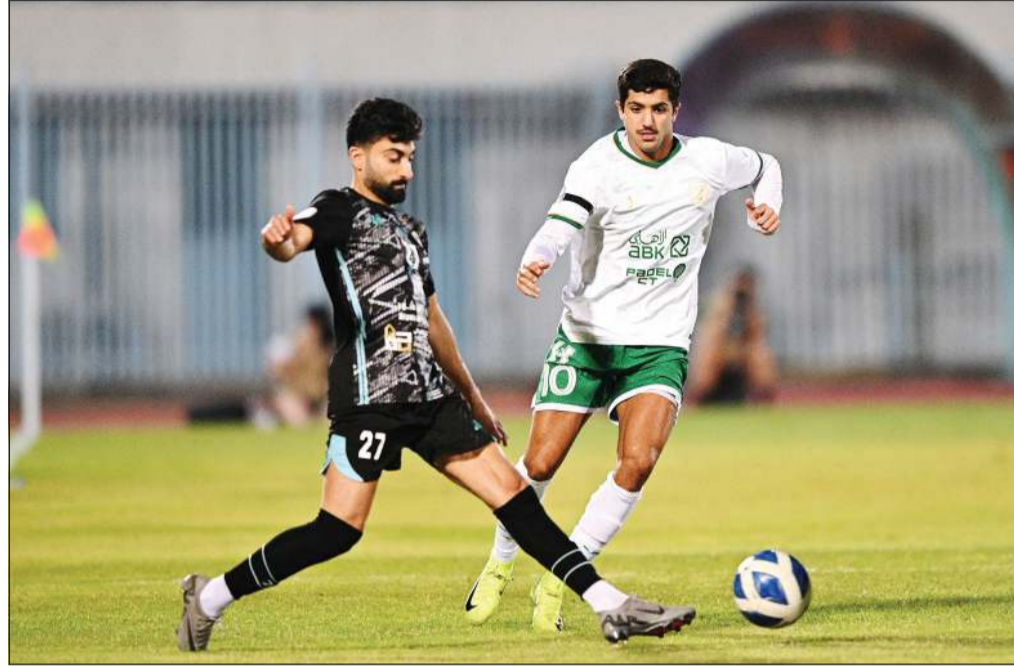
جانب من مباراة العربي والسالمية في القسم الأول التي انتهت لصالح «الأخضر» 3-1

في مباراة القادسية وخيطان، فإن «الأصفر» يسعى إلى زيادة نقاطه من أجل الدخول منافساً في مواجهات دور الـ 6 الأوائل بعدما تحسنت حالته في المباريات السابقة، غير أن فقدان نقاط كثيرة في البداية جعلته يتأخر إلى المركز الثالث وتوقف آماله في المنافسة على اللقب على نتائج المتصدرين، الكويت والعربي، ولا شك أن مدرب القادسية بيتروفيتش سيجد صعوبة في التوازن بين مسابقاته