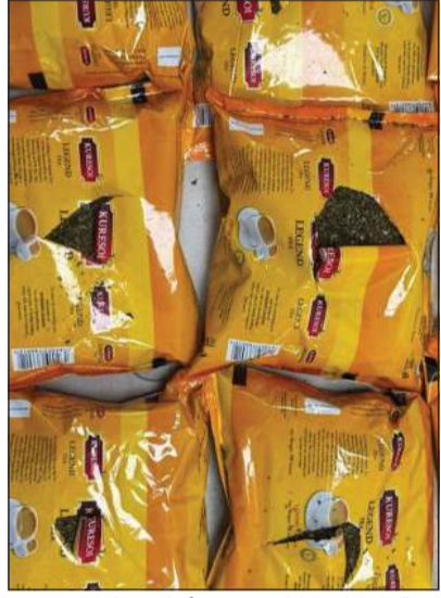
كمية من الماريغوانا هربت في أكياس شاي

في المسافرين الأول وأثناء تفتيش أمتعته تبين أنه يحمل أكياس شاي ملغمة بمادة الماريغوانا المخدرة، أما المسافر الثاني فتم ضبطه وهو يملأ بنطاله بأكياس الماريغوانا بطريقة مبتكرة، وعليه تمت إحالتهم إلى جهات الاختصاص.