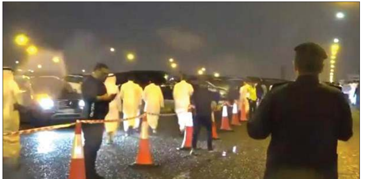
تحديد مسارات لانتقال المصلين إلى المسجد الكبير