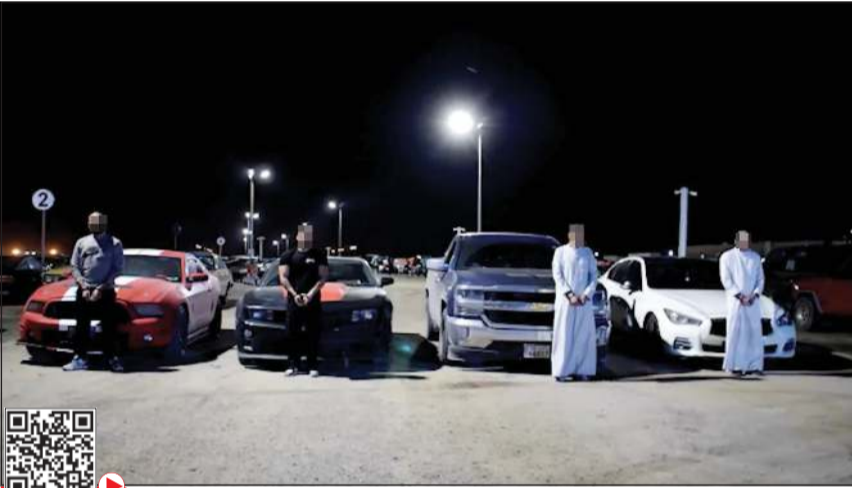
عدد من المستهترين وخلفهم المركبات التي استخدمت في الاستهتار