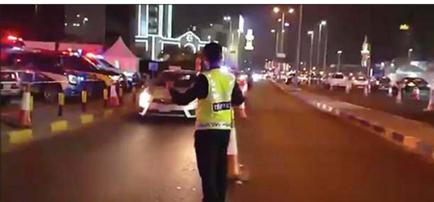
.. وآخر يتوقف في منتصف الطريق لتسهيل حركة السير

أكدت وزارة الداخلية أن الهدف من تواجدها بكثافة وبشكل منتظم في محيط المساجد التي تشهد كثافة مصلين في العشر الأواخر من شهر رمضان المبارك تنظيم حركة السير ومنع الازدحام وتوفير بيئة آمنة لجموع المصلين ولضمان سلامتهم. وقالت الوزارة في مقطع بثته على منصة «إكس»: «أمانكم أولويتنا وسلامتكم مسؤوليتنا»، تحرص وزارة الداخلية على أن يكون الطريق إلى المساجد أكثر أمنا لذا عززت تواجدها في محيط المساجد. ودعت الداخلية المواطنين والمقيمين إلى الالتزام بالإرشادات المرورية، لافتة إلى أن الوقوف الخطأ والعشوائي قد يعوق الآخرين وكذلك فإن العبور الخطأ للطريق في غير مسارات المشاة قد يعرض الآخرين للخطر، داعية إلى المشاركة بين «الداخلية» والمواطنين والمقيمين كي يكون الطريق أكثر أمنا.