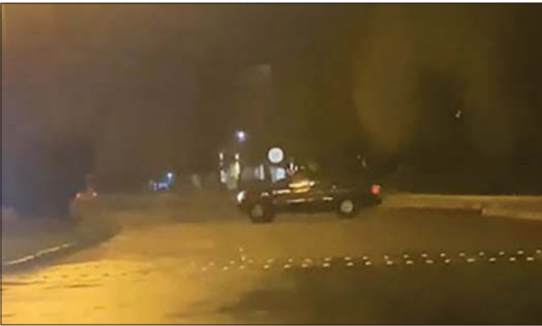
الاستهتار خلال الأمطار كان موضع متابعة من وزارة الداخلية

أعلنت وزارة الداخلية عن إحالة 8 مستهترين إلى السجن المركزي لتعريضهم حياة الآخرين للخطر خلال موجة الأمطار التي تأثرت بها البلاد مؤخرا. وقالت وزارة الداخلية في بيان لها: بناء على توجيهات رئيس مجلس الوزراء بالإحالة الشيخ فهد اليوسف، تمكن قطاع المرور والعمليات من ضبط 8 مستهترين ظهروا في مقاطع فيديو متداولة على مواقع التواصل الاجتماعي، وهم يمارسون سلوكيات خطيرة تعرض حياتهم وحياة الآخرين للخطر في عدة مناطق من البلاد.