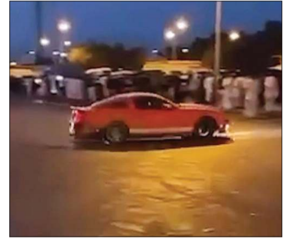
مقطع مركبة شخص مستهتر تم توثيقه بواسطة نشطاء على وسائل التواصل