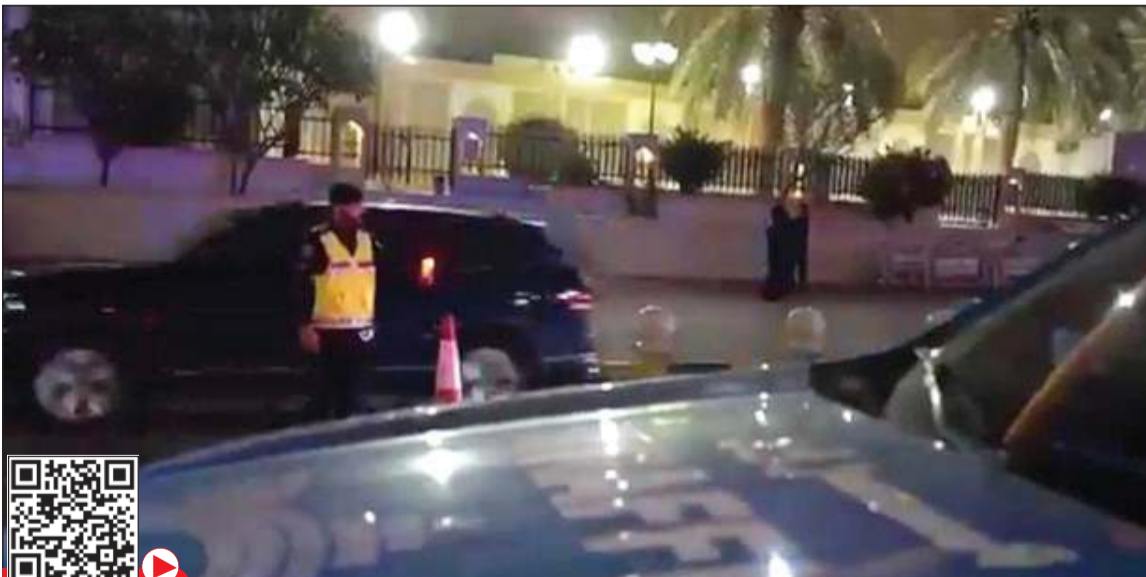
أحد رجال الأمن ينظم حركة المرور