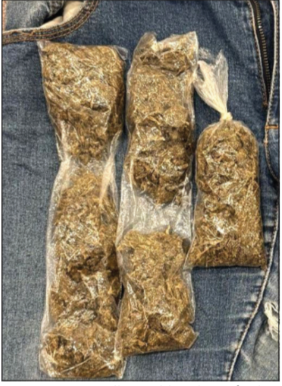
مسافر أخفى ماريغوانا في بنطلونه