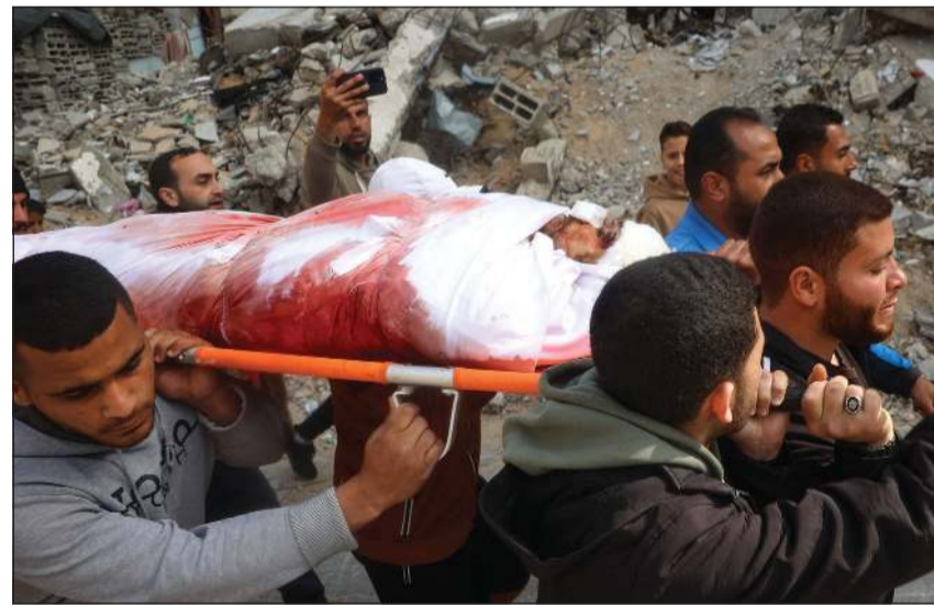
فلسطينيون يشيعون شهيدا في مخيم اليرج للاجئين في وسط قطاع غزة

يجبرون على شرب مياه غير آمنة، ما يؤثر سلبا على صحتهم. ودعت المنظمة إسرائيل إلى وقف إطلاق النار فوراً والسماح بدخول المساعدات الإنسانية إلى غزة وإعادة الكهرباء.