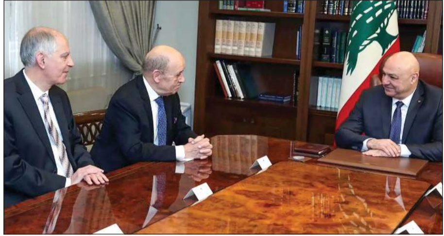
الرئيس اللبناني العماد جوزف عون مستقبلاً المبعوث الخاص للرئيس الفرنسي جان - إيف لودريان بحضور السفير الفرنسي لدى لبنان ميرفي ماغرو (محمود الطويل)

تقل أهمية عن تعيين قادة أمنيين جدد عشية توجه الرئيس عون إلى العاصمة الفرنسية باريس للقاء الرئيس إيمانويل ماكرون، ومناقشة ملفين أساسيين: الانسحاب الإسرائيلي الكامل من الجنوب، وطلب عقد مؤتمر دولي بإشراف فرنسي لتأمين مساعدة لبنان في النهوض الاقتصادي وإعادة الرئاسة.