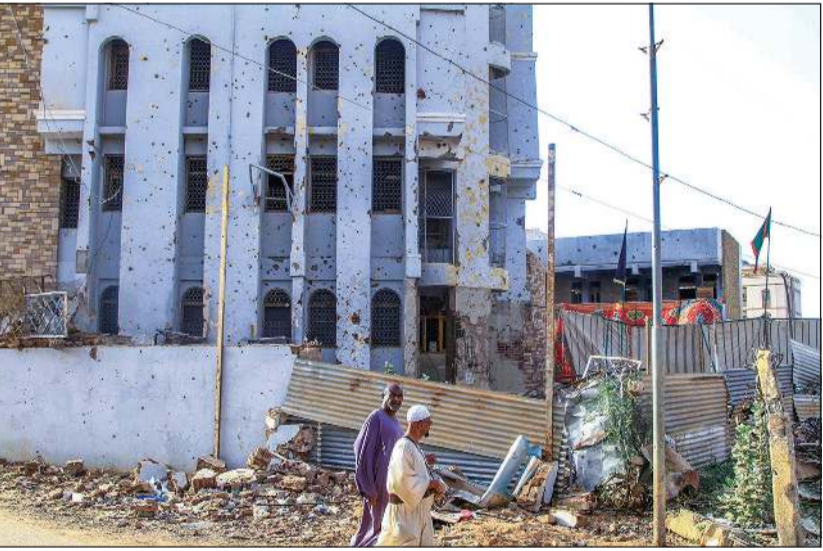
بناء أصابته أضرار نتيجة الاشتباكات في أم درمان تروم مدينة الخرطوم

وفي وقت سابق، أكد قائد عمليات الخرطوم أن قوات الجيش تقدمت في شرق الخرطوم. وأضاف أنها تمكنت من عبور جسر المشبية وتنشيط المنطقة الشرقية للجسر بالكامل، وأشار الجيش السوداني إلى أنه كبد «قوات الدعم السريع»، خسائر كبيرة في المعدات والأرواح، في منطقة الباقير. كما أعلن الجيش تقدم قواته بسلاح المدرعات في مدينة الخرطوم، وأنه سيطر على مقر الدفاع الجوي بالخرطوم.