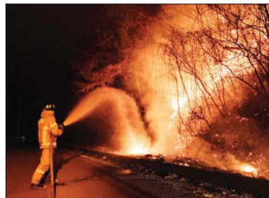
رجل إطفاء يحاول إخماد حرائق الغابات المستعرة في كوريا الجنوبية

وصرح الرئيس التنفيذي للشبكة الوطنية جون بيتيغرو، لصحيفة «فاينانشيال تايمز»، بأن الطاقة الكهربائية بقيت متوافرة للمطار في غرب لندن عبر محطتين فرعيتين أخريين. وأضاف: «لم يكن هناك نقص في الطاقة من المحطات الفرعية، كل محطة فرعية على حدة قادرة على توفير طاقة كافية لمطار هيثرو». وأوضح أن «فقدان محطة فرعية حدث فريد من نوعه، ولكن كانت هناك محطات