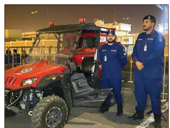
الاستعانة بآليات صغيرة يسهل الانتقال بها