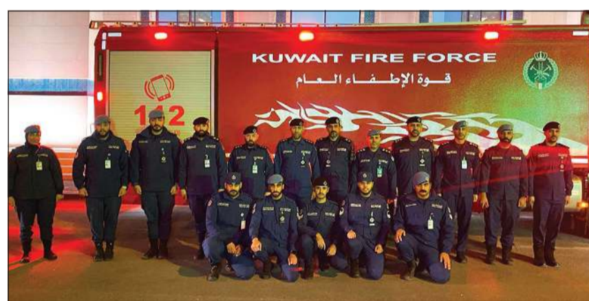
العميد أحمد ناصر عبدالله متوسطاً عدداً من ضباط وضباط صف الإطفاء في إحدى النقاط

دور العبادة لشروط السلامة والوقاية من الحريق من أجل حماية الأرواح والممتلكات، وتحقيق الأمن المجتمعي.