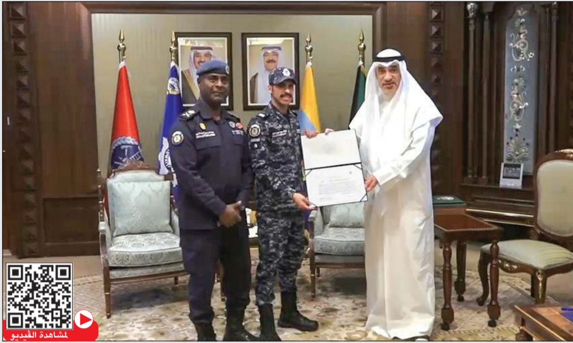
رئيس مجلس الوزراء بالإنيابة الشيخ فهد اليوسف مكرما وكيل ضابط نواف النصار بحضور الوكيل المساعد لقطاع الأمن الخاص اللواء عبدالله سباع الملا