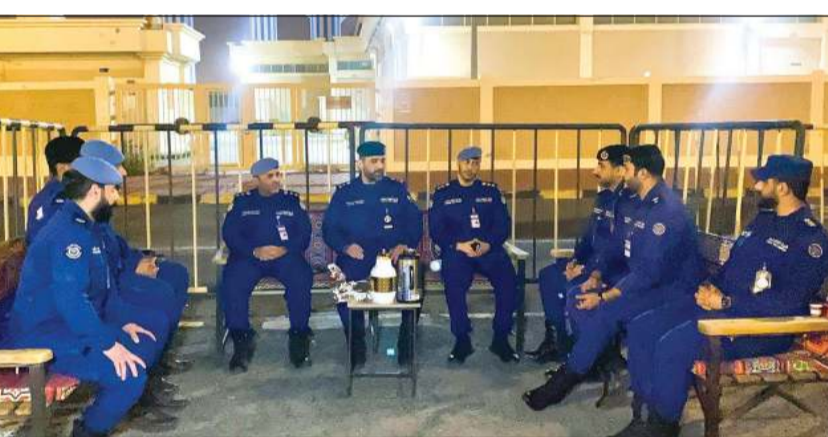
العميد أحمد ناصر عبدالله متحدثاً لعدد من رجال الإطفاء