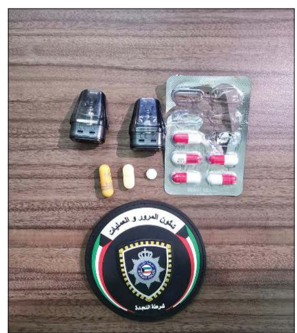
سجائر الحشيش الإلكترونية والحبوب المصبوطة على طريق الملك فهد