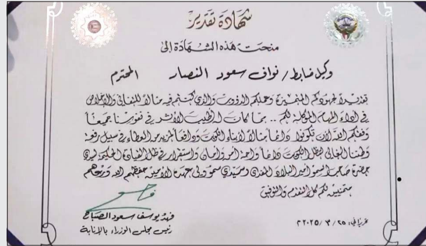
صورة من شهادة التكريم

كرم رئيس مجلس الوزراء بالإنيابة الشيخ فهد اليوسف، بحضور الوكيل المساعد لقطاع الأمن الخاص اللواء عبدالله سباع الملا، وكيل ضابط نواف النصار من مرتبات قطاع الأمن الخاص، وذلك تقديراً لدوره في كشف شبكة التلاعب المتورطة في نتائج السحوبات، وذلك من خلال تسجيله عدة مقاطع فيديو من البث المباشر لعملية السحب، والتي كشفت وجود تحاليل. وأشاد اليوسف بيقظة وكيل ضابط نواف النصار، مؤكداً أن هذا التكريم يأتي تقديراً لجهوده في تعزيز النزاهة وحماية حقوق المجتمع، ومثالا للروح المهمة الذي يؤديه رجال الأمن في الحفاظ على العدالة والشفافية.