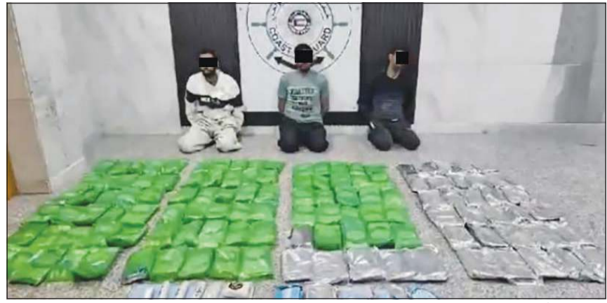
المتهمون وأمامهم المضبوطات من المواد المخدرة

بعد رصد طراد مشبوه عبر المنظومة الرادارية .. والمخدرات تقدر قيمتها السوقية بـ 500 ألف دينار