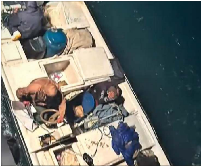
الطراد المشبوه بعد توقيفه

أعلنت وزارة الداخلية أن رجال الإدارة العامة لخفر السواحل ضبطوا ما يزيد على 125 كيلو حشيش وحبوب لاريكا وكابتي بحوزة 3 وافدين، مشيرة إلى أن المضبوطات تقدر قيمتها السوقية بنحو نصف مليون دينار. وذكرت الوزارة في بيان صادر عنها «في عملية نوعية، وجهت الإدارة العامة لخفر السواحل ضربة لمحاولات تهريب المخدرات إلى البلاد، حيث تمكنت من إحباط محاولة تهريب عبر المياه الإقليمية وضبطت كمية من المواد المخدرة حاول 3 أشخاص من الجنسية الإيرانية تهريبها إلى البلاد وعثر بحوزتهم على نحو 125 كيلو حشيش و9 أصابع حشيش و8 شرائط لاريكا و5 أكياس حبوب كبتي، تقدر قيمتها السوقية بنحو 500 ألف دينار».