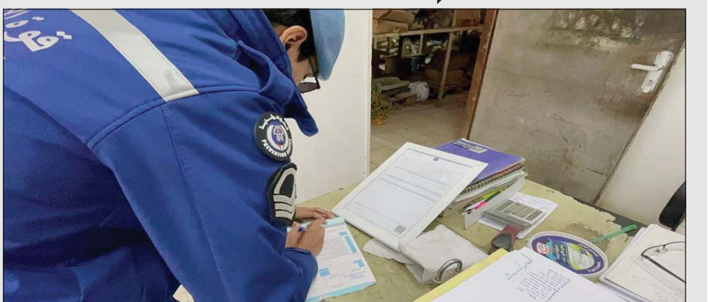
جانب من تحرير المخالفات

نفذت قوة الإطفاء العام حملة تفتيشية صباح أمس استهدفت عدداً من المباني والمنشآت للتحقق من مدى التزامها باشتراطات السلامة. وقال بيان صادر عن قوة الإطفاء أن الحملة تأتي في إطار جهودها المستمرة لتعزيز السلامة والوقاية من الحرائق، وقد أسفرت الحملة عن رصد وتحرير عدة مخالفات، بحق منشآت ومبانٍ لم تستوفِ الاشتراطات المعتمدة من قبل قوة الإطفاء العام. وأكدت في ختام بيانها أن هذه الحملات في إطار حرص القوة على تطبيق معايير السلامة والحد من المخاطر حفاظاً على الأرواح والممتلكات.