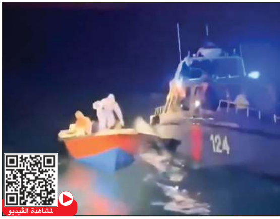
دوريات خفر السواحل تعقب طراد فور دخوله المياه الإقليمية

ومن الضروري أن نشير إلى أن القانون الجديد سمح للعمالة المنزلية بالبقاء خارج البلاد 4 أشهر متوالية، فإذا زادت على ذلك سقطت بالإقامة حتى وإن كانت صالحة لمدة أطول، أما بالنسبة لباقى المقيمين - عدا أبناء الكويتية وملاك العقارات ومن حصل على الإقامة بصفته مستمرا - فعليهم عدم البقاء خارج الكويت لمدة تزيد على 6 أشهر متوالية والإسقاط حقهم بالإقامة المخصص لهم بها، ويمكن لمن لديه ظرف قاهر يمنعه من العودة خلال المدة المحددة أن يحصل على