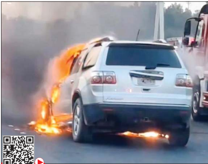
... وتبدو التياران مستعرة داخل المركبة