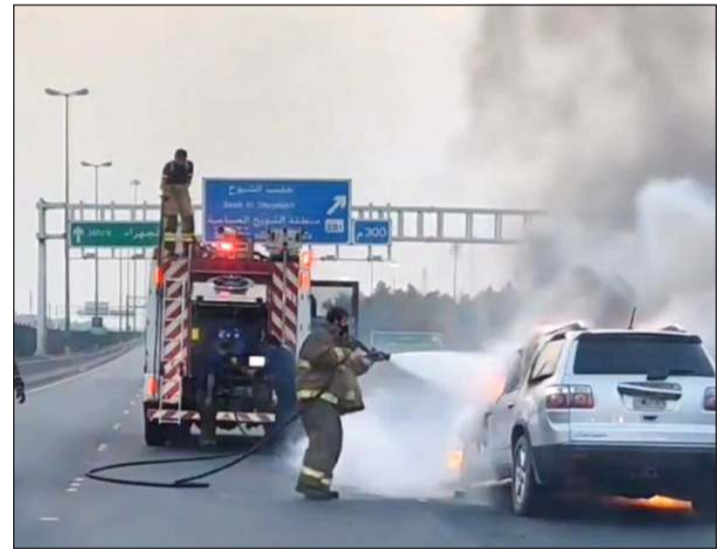
رجل إطفاء يخمد الحريق الذي أدى إلى التهام المركبة