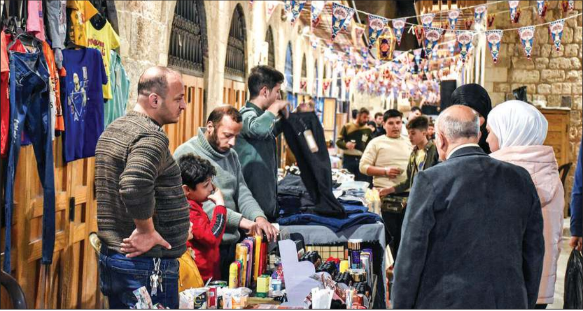
صورة نشرها موقع جريدة «الوطن» للإقبال على بسطات الألبسة في أسواق حلب

التسعير بالدولار، ما جنّبهم تقلبات الليرة. بموازاة ذلك، تشهد أسواق الحلويات المعروضة، ما أعاد الحيوية إلى حركة البيع والشراء، خاصة بين ذوي الدخل المحدود. وتقلت صحيفة «الحرية» عن أحد تجار سوق «الجزيرية» في دمشق، أن أسعار الشوكولا تراجعت هذا الموسم بنسبة تصل إلى 50% في بعض الأصناف، مدفوعة بعوامل أبرزها فتح بعض الأسواق الخارجية، وتحرير مناطق حيوية مثل حلب، ما أسهم في زيادة المعروض وتنويعه.