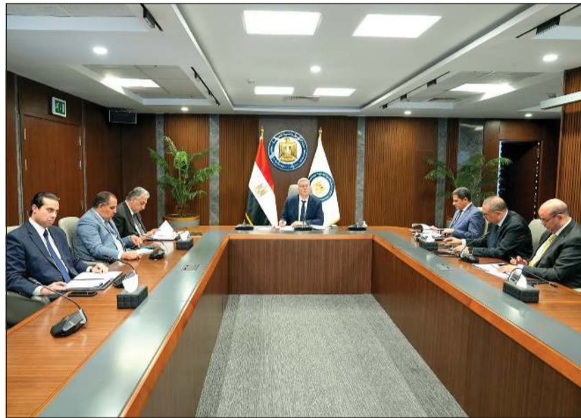
وزير البترول والثروة المعدنية م. كريم بدوي خلال الجمعية العامة لشركة رشيد للبتترول والبرلس للغاز

أكد وزير البترول والثروة المعدنية م. كريم بدوي، أن سرعة وضع آبار الغاز الجديدة ضمن المرحلة العاشرة لتنمية منطقة غرب الدلتا العميق على خريطة الإنتاج وربطها بالشبكة القومية للغاز الطبيعي، يمثل خطوة مهمة في تنفيذ المحور الأول من استراتيجية الوزارة لزيادة إنتاج مصر من الغاز الطبيعي، مشيداً بالجهود المبذولة في هذا الصدد من فرق عمل شركة رشيد والبرلس المنفذة لعمليات المشروع، وشركاء الاستثمار شل وبتروناس العالميتين.