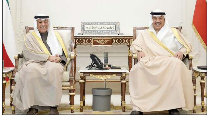
سمو ولي العهد الشيخ صباح الخالد مستقبلاً الأمين العام لمجلس التعاون لدول الخليج العربية جاسم البديوي

كونا: استقبل صاحب السمو الأمير الشيخ مشعل الأحمد بقصر بيان صباح أمس وبجضور سمو ولي العهد الشيخ صباح الخالد، استقبل سموه رئيس مجلس الوزراء بالإتابة الشيخ فهد اليوسف، حيث قدم لسموه د. صباح المخيزيم وزيراً للكهرباء والماء والطاقة المتجددة، حيث أدى اليمين الدستورية أمام سموه بمناسبة تعيينه في منصبه الجديد. حضر مراسم أداء القسم كبار المسؤولين بالدولة. كما استقبل صاحب السمو الأمير الشيخ مشعل الأحمد بقصر بيان صباح الأمين العام لمجلس التعاون لدول الخليج العربية جاسم البديوي. وكان صدر مرسوم أميري بتعيين صباح المخيزيم وزيراً للكهرباء والماء والطاقة المتجددة فيما يلي نصه: بعد الاطلاع على الدستور،