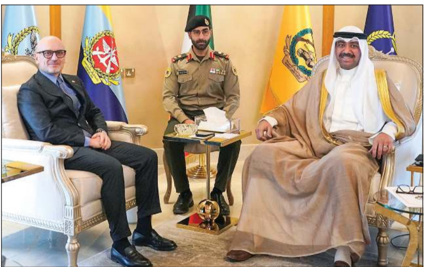
وزير الدفاع ووزير الداخلية بالإتابة الشيخ عبدالله العلي مستقبلاً السفير الإيطالي لورينزو موريني

استقبل وزير الدفاع ووزير الداخلية بالإتابة الشيخ عبدالله العلي في مكتبه بوزارة الدفاع سفير الجمهورية الإيطالية لدى الكويت لورينزو موريني. وتم خلال اللقاء تبادل الأحاديث الودية ومناقشة أهم المواضيع ذات الاهتمام المشترك، حيث أشاد العلي بعمق العلاقات الثنائية التي تجمع بين دولة الكويت والجمهورية الإيطالية الصديقة، وما تشهده من تعاون بناءً في مختلف المجالات.