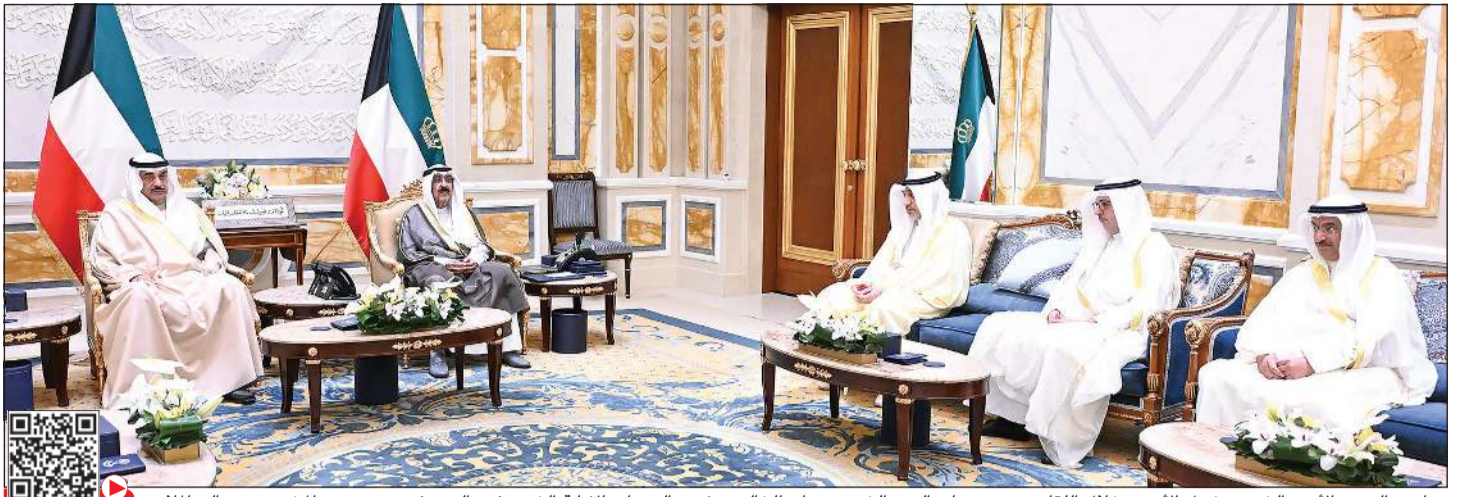
صاحب السمو الأمير الشيخ مشعل الأحمد خلال اللقاء مع سمو ولي العهد الشيخ صباح الخالد ورئيس الوزراء بالإتابة الشيخ فهد اليوسف ود. صباح المخيزيم وصالح الملا