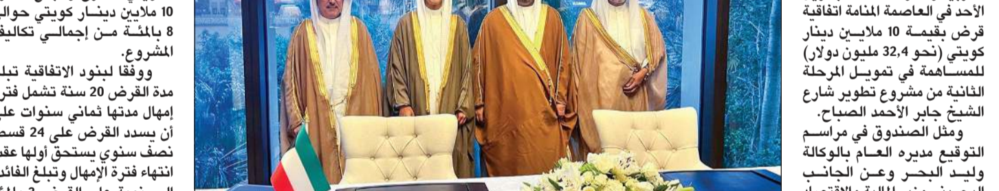
وليد البحر ووزير المالية البحريني الشيخ سلمان بن خليفة لدى توقيع العقد بحضور سفيرنا بالمنامة الشيخ ثامر الجابر

المنامة - كونا: وقع الصندوق الكويتي للتنمية الاقتصادية العربية وحكومة مملكة البحرين الأحد في العاصمة المنامة اتفاقية قرض بقيمة 10 ملايين دينار كويتي (نحو 32,4 مليون دولار) للمساهمة في تمويل المرحلة الثانية من مشروع تطوير شارع الشيخ جابر الأحمد الصباح.